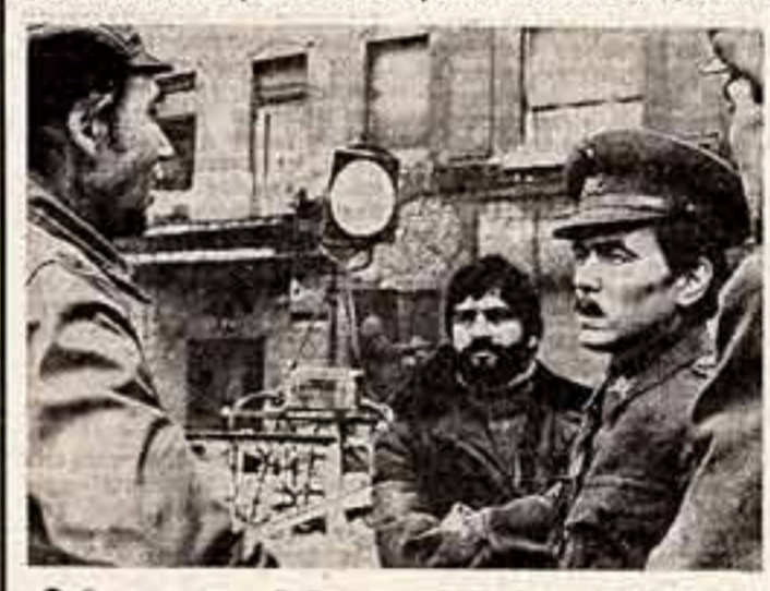
Мате Залки.

23 апреля — 80 лет со дня рождения Мате Залки (1896—1937), австрийского писателя, героя гражданской войны в СССР и национально-революционной войны в Испании. Мастера экранов СССР и ВНР работают над созданием художественной кинокартины о венгерском писателе Мате Залки.