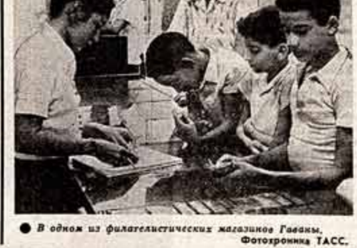
В одной из филателистических магазинов Гаваны.

Улучшение филателистического шолькинского стало массовым явлением на Кубе. Темы их коллекций самые разные: «В. И. Ленин», «Страны нашей истории», «Географические открытия», «Музыка в филателии» и многие другие.