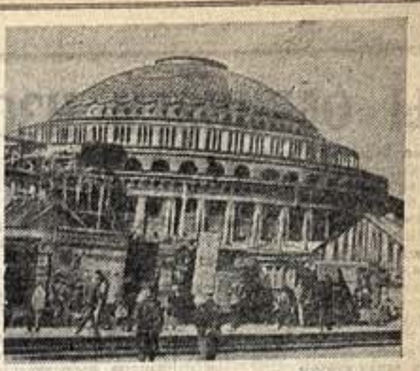
Новый большой оперный театр на 1.600 мест в Новосибирске.