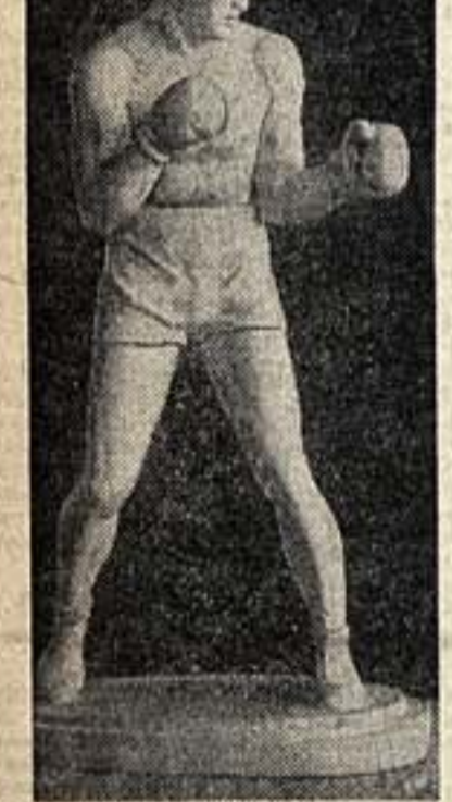
Скульптор Нопин. «Бокс».