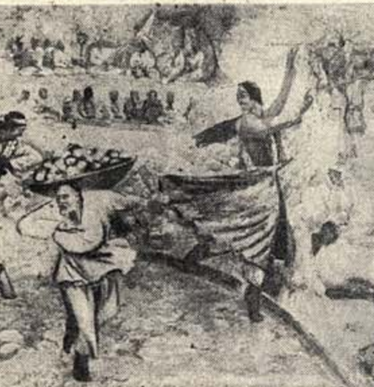
Выставка узбекской живописи О. Татовский, «Копчозный той». Фрагмент картины.

Надо признать, что в нашей практике оформления стоимити полнотой художественных работ достигается очень немного.