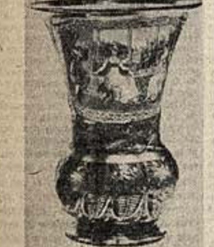
Выставка цветного стекла в музее «Эрмитаж». Цветное стекло середины XIX в.

Восковой комитет по делам искусств решил провести в Москве, Ленинграде, Киеве, Тбилиси и Минске с 14 по 25 ноября декаду творчества советских композиторов.