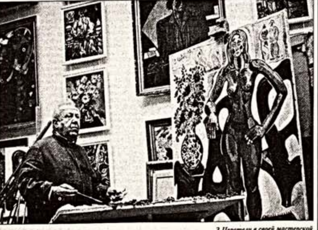
З.Церетели в своей мастерской