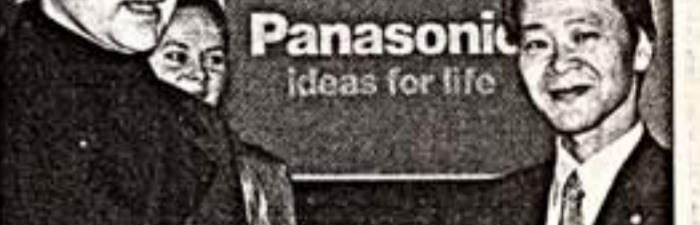
А.Лиена в вице-президент компании Panasonic CIS M. Моток