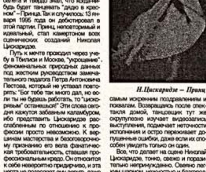
Н. Цискаридзе — Принц в сцене из спектакля "Шелкунчик"

Еще в начале 90-х годов проницательные японцы назвали юного Николая Цискаридзе "танцовщиком XXI столетия". И не ошиблись. Николай Цискаридзе, абсолютно уникальный танец, эпатирующий Принца Большого театра в предновогоднюю ночь исполнителем 30 лет. Свой день рождения — 31 декабря — он всегда отмечал на сцене, и чаще всего в роли Принца в "Шелкунчике" на сцене родного театра. (Гражданин, однажды изменил сложившейся традиции, когда в свой день рождения танцевал Солова в театре Орепа Васильева. Тогда он как протестующий заведующий дебютировал в муромской "Балетной").