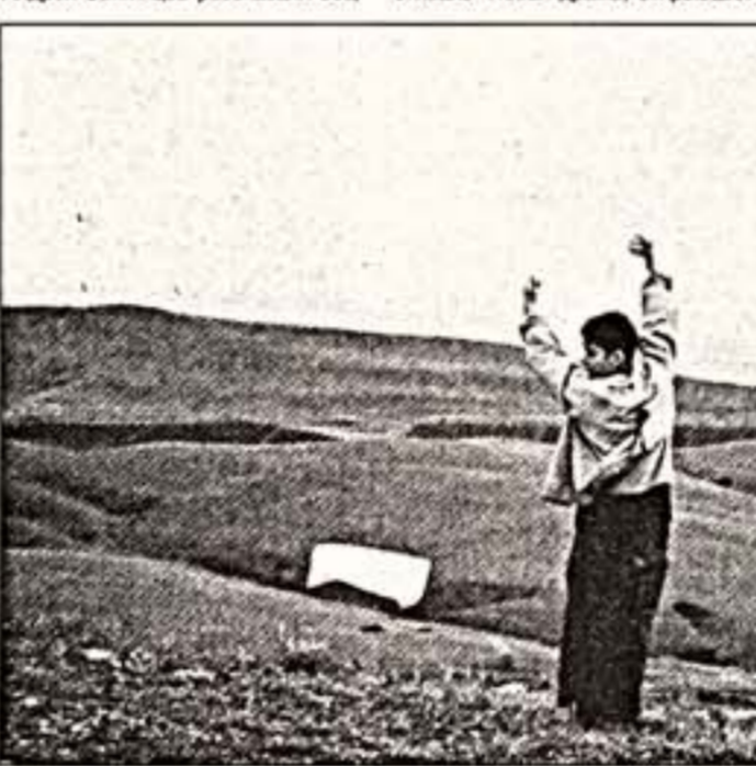
Кадр из фильма "Коктебель" А. Поповича и Б. Хмельникова