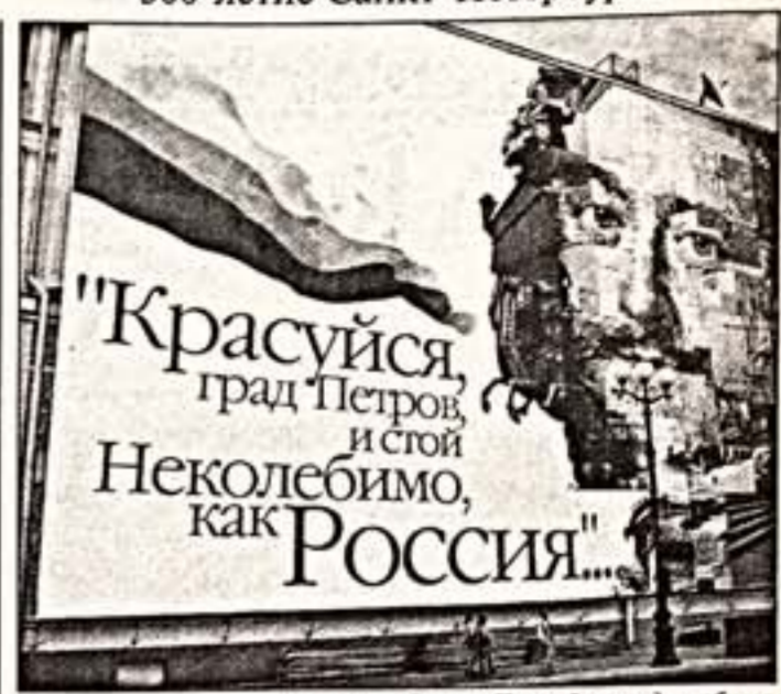
На улицах Санкт-Петербурга в дни юбилея