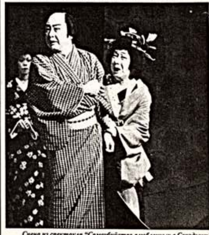
Сцена из спектакля "Самойубство влюбленных в Сондзаку"