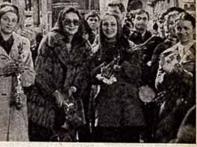
Гости из Польши на московской земле.