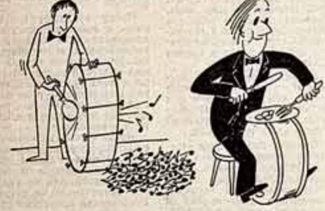
Как-то о барабанах. Рисунки В. Владова и А. Савчука.