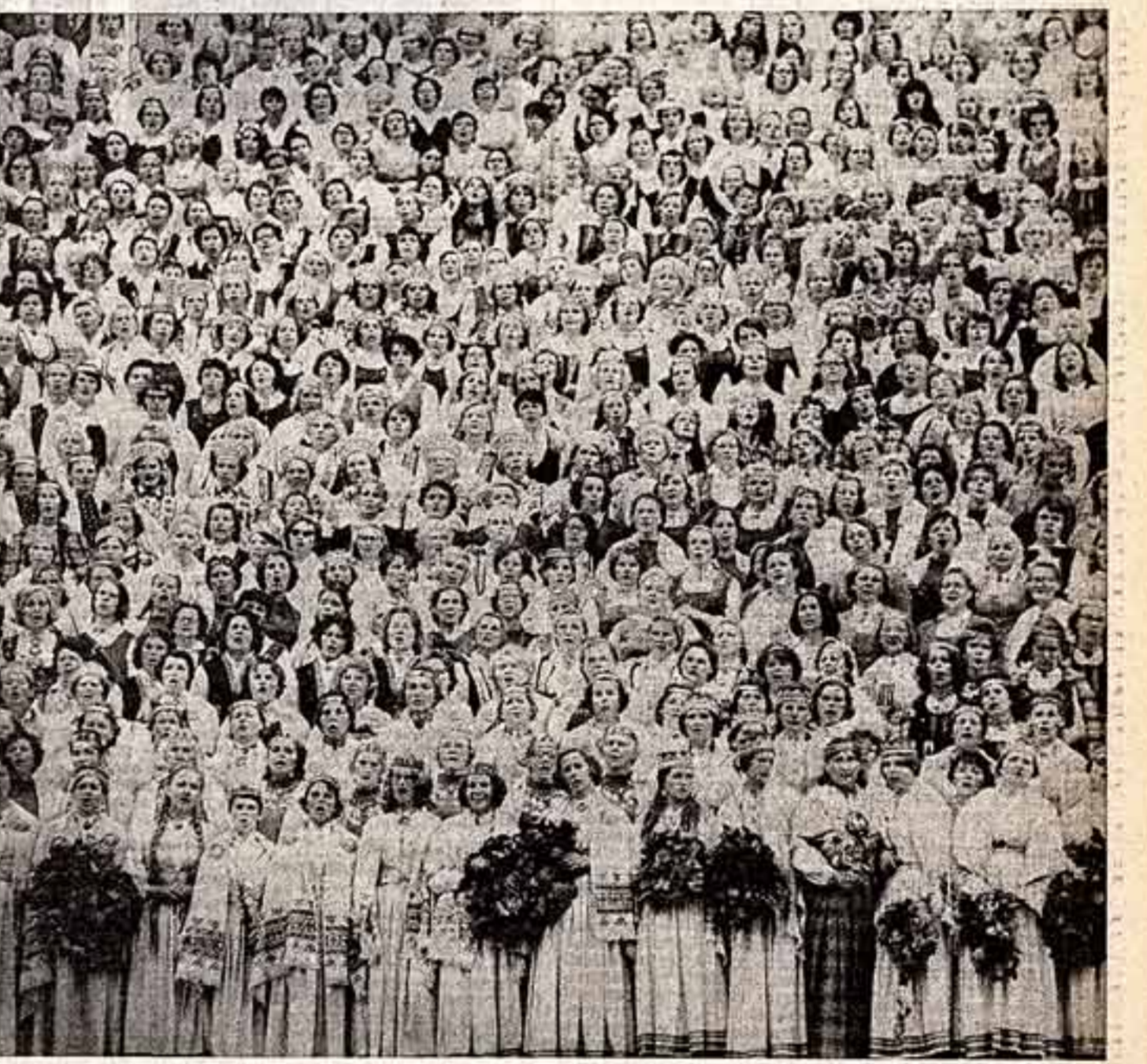
Все поют — от малод до велика.

Если до революции самый популярный таджикский гафиз имел в своем репертуаре только небольшой запас песен, бытовавших в народе, то репертуар современного певца состоит из песен народов СССР или же народов мира.