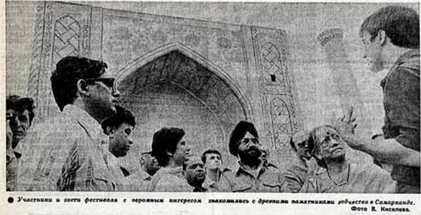
Участники и гости фестиваля с озорными интересом знакомятся с фрешиями памятниками искусства в Самарканде.

А. Броусил: В 1946 году в сказке при встрече с Жоржем Седулем, что его «История мирового кино» неординарна по своей значимости, но что ее споры придется переписать.