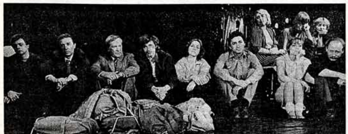
Театр имени Ленинского комсомола показал премьеру «Проводим эксперимент» В. Черных и М. Захарова...