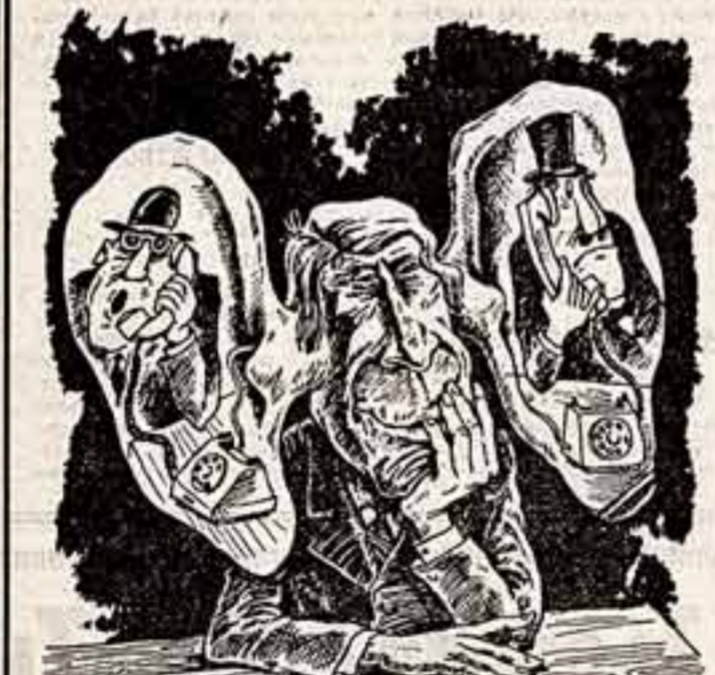
— Все, что я вам сообщил, должно остаться только между нами двумя и тем, кто нас подслушивает!