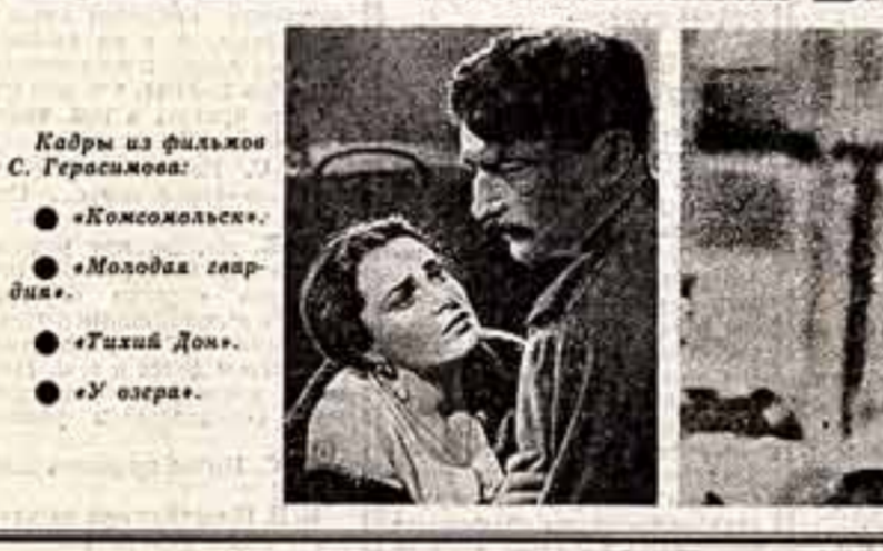
Кадр из фильма С. Герасимова: «Комсомолец», «Молодая гвардия», «Тихий Дон», «У озера».