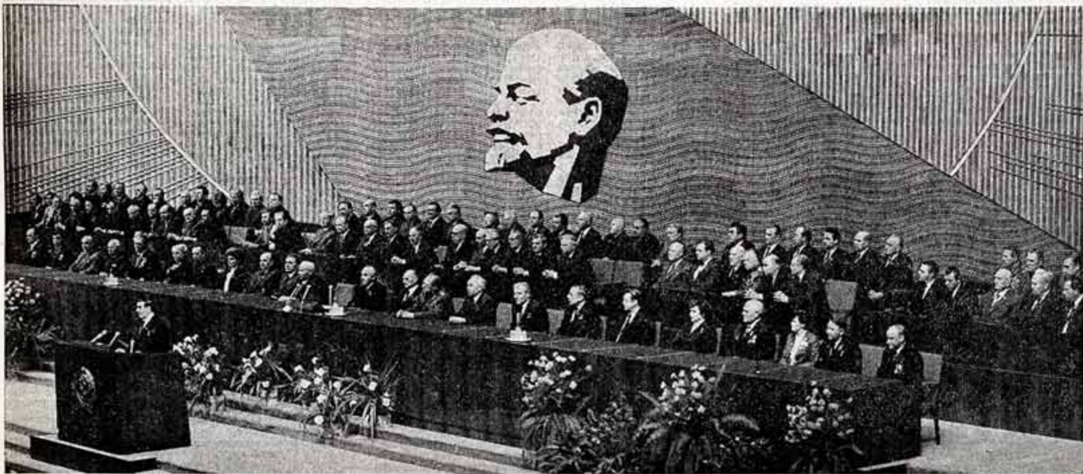
Торжественное заседание, посвященное 114-й годовщине со дня рождения В. И. Ленина.