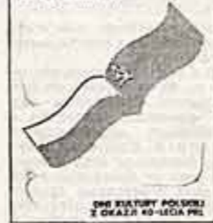
Дни польской культуры в СССР, посвященные 40-летию образования ПНР.

Дружба, братство, единство — на русском и польском языках звучали эти слова 19 апреля в Большом театре Союза ССР. Здесь состоялось торжественное открытие Дней польской культуры в Советском Союзе, посвященных 40-летию образования ПНР.