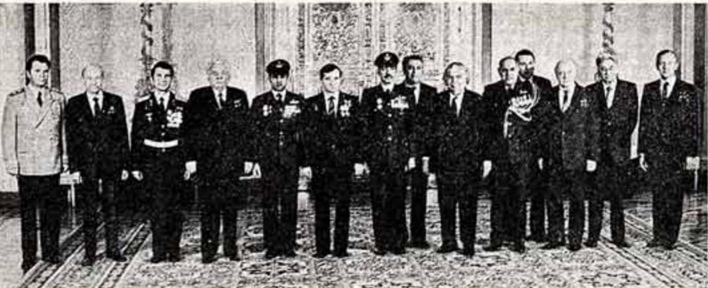
Во время вручения наград.

В Кремле вручены высокие советские награды космонавтам СССР и Индии