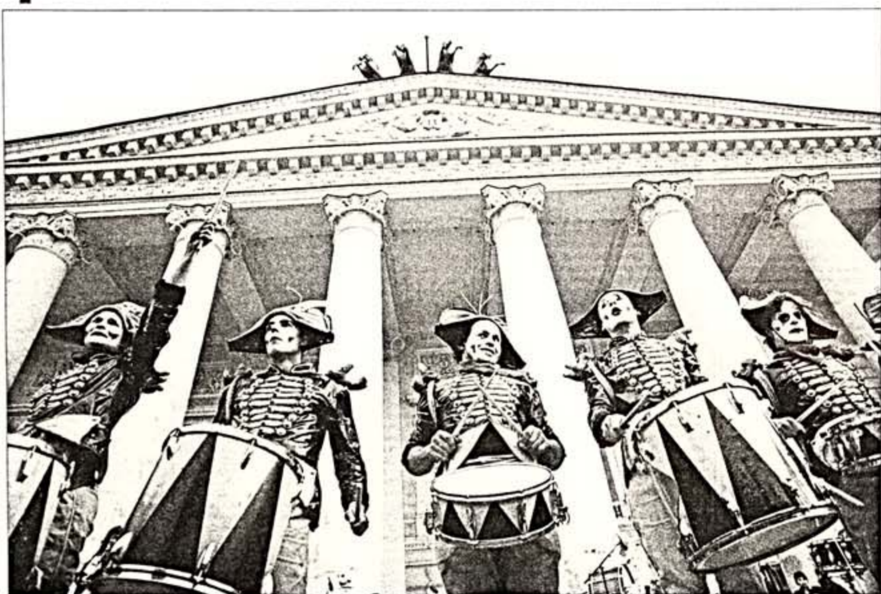
Открытие Всемирной театральной олимпиады

21 апреля в Москве торжественно открылась III Всемирная театральная олимпиада. Все началось в 17.45 на Театральной площади. К этому времени уже забил фонтан перед Большим театром, а перед фасадом Малого театра – выдающийся портал с скульптурным ансамблем «Сквозняк» с двух сторон античных скульптур. Перед порталом сверкала водная гладь искусственного бассейна. По ней некто не плыл, но когда зрители-ирреалисты-фантазеры, водное зеркало задрожало волнами. Публику задрожали барабанные дроби – это был международный «удачный шум». Три коллектива, ансамбль ударных инструментов Марка Пекарского, бельгийский «Джаз-Бокс» (африканские барабаны) и итальянский «Даддэ», эрфетно прощались по площади в средневековых латах – такой был очень