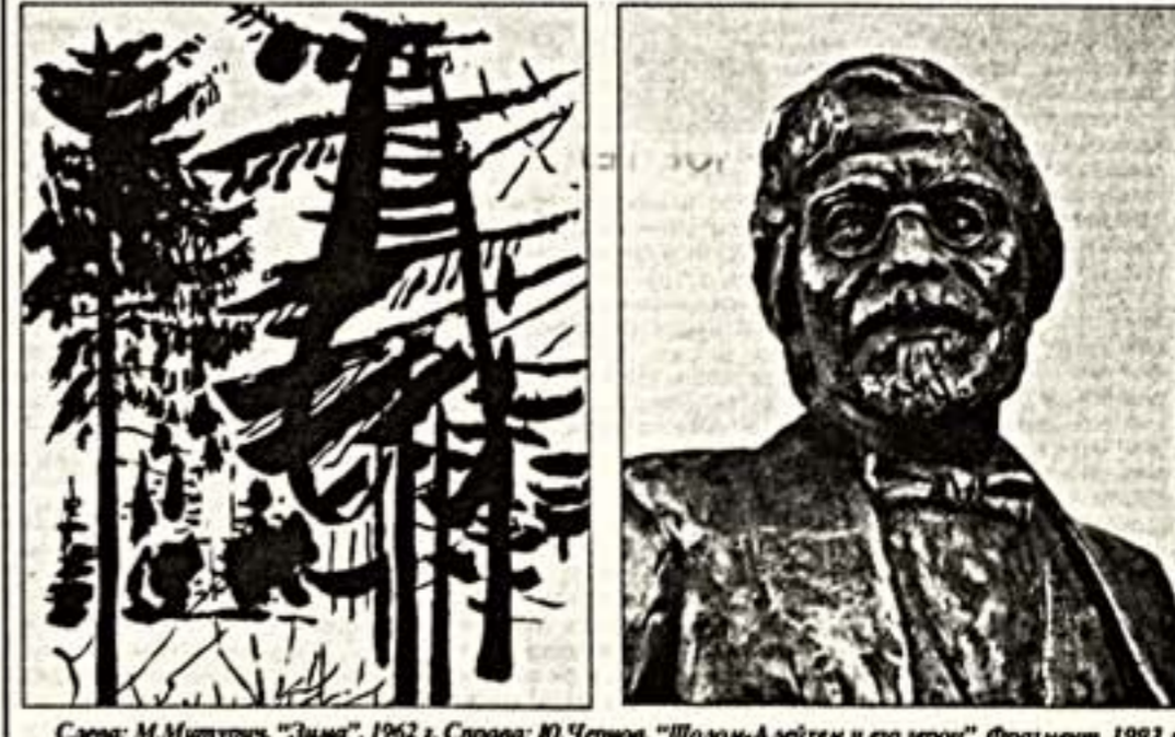
Слева: М.Митурич. “Зима”, 1962 г. Справа: Ю.Чернов. “Шолом-Алейхем и его герои”, Фрагмент, 1993 г.