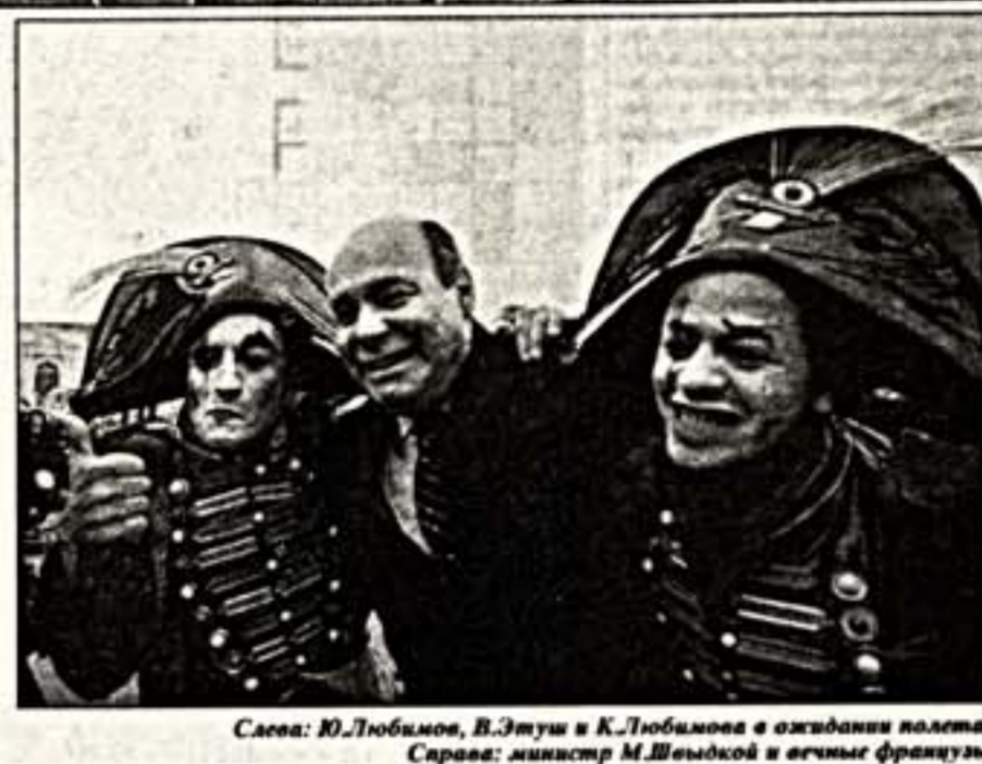
Слева: Ю.Лужков, В.Шадрик и К.Любимов в ожидании полета. Справа: министр М.Швыдкой и актеры французского театра