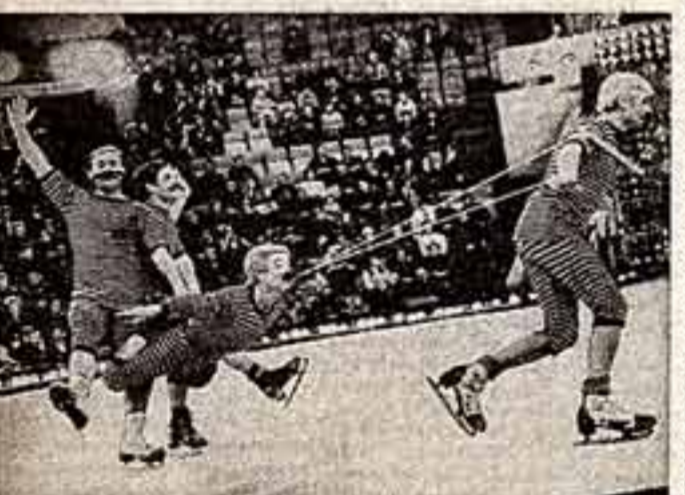
Этих веселых акробатов по традиции зовут «коверчане», хотя arena, на которой они выступают, ни на взгляд, ни на ощупь хоера не напоминает. Выступают клоуны Московского цирка на льду.