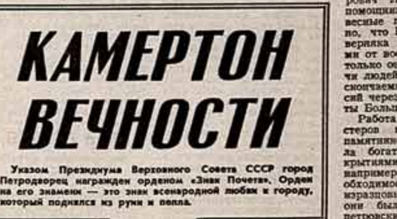
Указом Президиума Верховного Совета СССР город Петродворец награжден орденом «Знак Почета».

В тот день в Петродворце гремела музыка, звучали стихи, обращенные к людям, старые поэтические героические усиления отволакивали войны эту красоту, дали ей