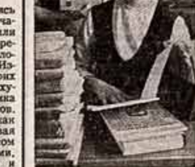
Молдавская ССР. Между Академией наук Молдавской ССР и научными центрами Калькутты, Мадраса, Аждабада...