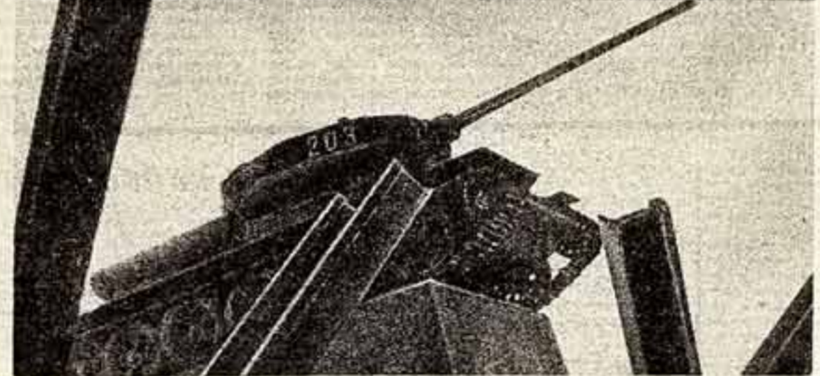
Героический Подмосквье, память славы первого года... От Вечного огня у Кремлевской стены и на западе, и Можайск, в Бородине, «Т-34» у Наро-Фоминска, «ЯК-3» на разбитых дорогах, памятник «Зое в Дорохово». В дни тридцатилетия победы под Москвой — честь Бронзы героев, честь оружие великого содружения!