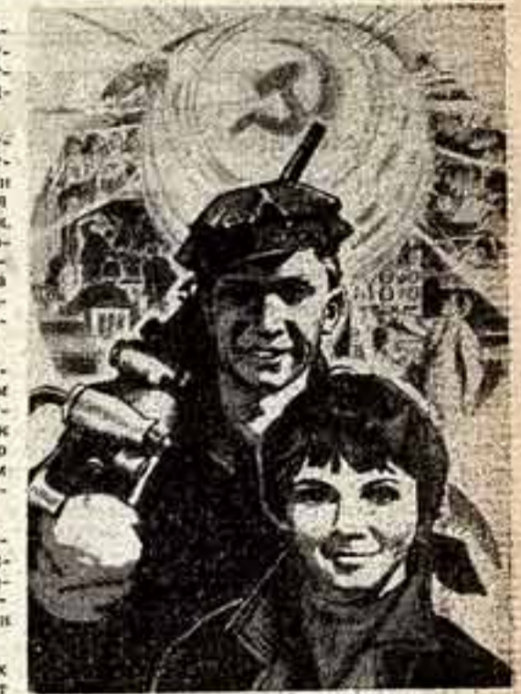
«Я ДОЧЬ СТРАНЫ, Я ЕЕ ВЕРНА! А Я ТВОЮ ВЕРНУЮ СЫН, СТРАНА! ПУТИ СУДЕБЫ У НАС ЯСНЫ. МЫ БЛАГОДЕРЖИ ПЛЫНИ ЗА ТО, ЧТО ВОЛЕЮ СТРАНЫ НАМ КОНСТИТУЦИЯ ДАНА». В. Сурыгин. Стихи А. Яарова. «Агитплакат».

«Столицей Союза Советских Социалистических Республик является город Москва», — гласит статья 145-й Конституции СССР. Это величайшее событие стали и каменной, и боевым прикладом в те грозные дни, когда на подступах к столице сыны всех народов СССР отбивали натиск фашистских захватчиков. 30-летие разгрома фашистских войск под Москвой подымает в наших душах волну горячих чувств: наша верность социалистической Родине беспредельна!