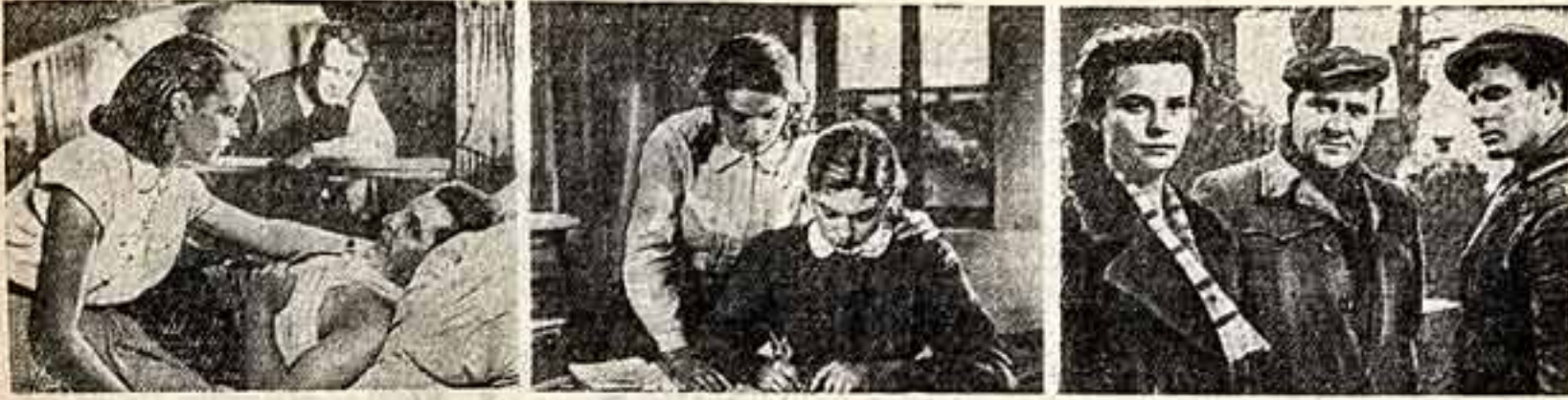
Кадр из фильма «Любовь и долг» (ГДР). Кадр из болгарского фильма «Ребро адамово». Кадр из польского фильма «Помоление».