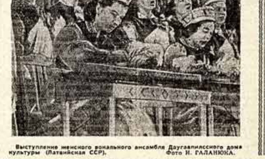
Выступление иенского вокального ансамбля Даугавпилсского дома культуры (Латвийская ССР).

Еще не умолкая аплодисменты последнего номера, как с противоположной стороны манежа раздалось веселое, задорное: «Добрый вечер! Здравствуйте! Извините, что опоздали!» (Ох, эти клоуны, они всегда опаздывают!). Тонка Козаров, лауреат Международного конкурса циркового искусства в Варшаве, являлся