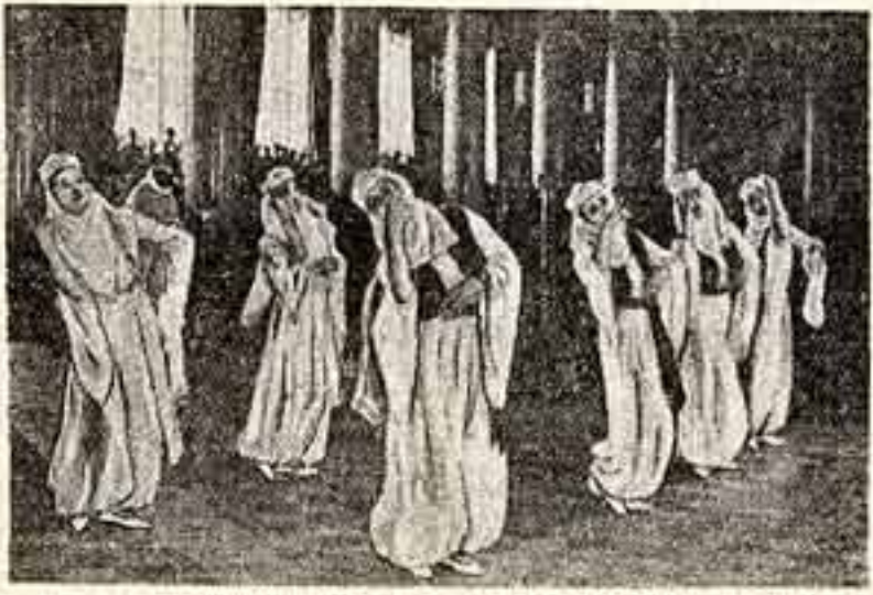
Выступление молодежного ансамбля сирийского радио в актовом зале Московского государственного университета имени М. В. Ломоносова.

Большой интерес к концерту арабских стран был совершенно закономерен: выступили делегации со своим ярким и самобытным искусством, которое весьма мало было знакомо многим участникам фестивалей и москвичам.