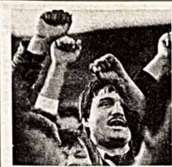
Аргументы или эмоции?

Кто же собрался на стадионе? Анкетирование, проведенное во время одной из дискуссий, показало, что примерно половина — слу-