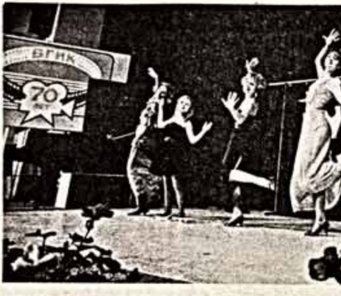
— ПЕРЕДАНО ИЗ КОРПУНКТА