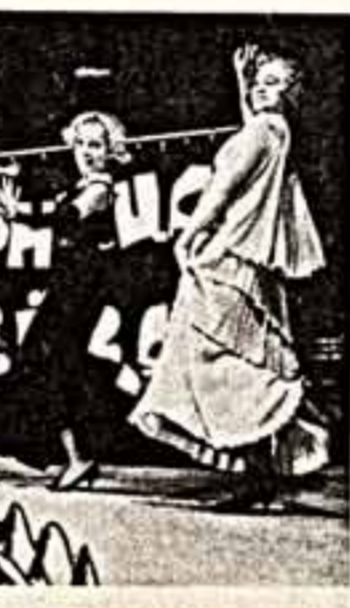
— ПЕРЕДАНО ИЗ КОРПУНКТА

В ТРИ ФРАЗЫ ● Народные традиции и современное эстрадное искусство — под таким девизом проходил Международный фестиваль в столице Хакасии Абакане. Своим мастерством демонстрируют артисты из Советского Союза, Болгарии, Польши, США, Швейцарии и других стран. Представительный музыкальный форум привлечет внимание также советских и зарубежных историков, этнографов, искусствоведов. ● В Вильнюсе на базе производственно-торгового объединения «Медтекс» и заводоуправления фирмы «Имбис» и «Вара» будет создано совместное предприятие. Оно станет производить ежегодно 182 миллиона одноразовых шприцев, а также сложную медицинскую технику. Для приобретения новейшей технологической оборудования кредит предоставит банк ФРГ, заручившись партнерами обеспечения предприятия и сырья.