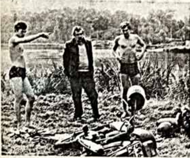
На киностудии «Мосфильм» снимается картина «Трагедия в старом городе». Автор сценария и режиссер-постановщик Саяа Кулям. Оператор-постановщик В. Фоттиско и В. Камин.