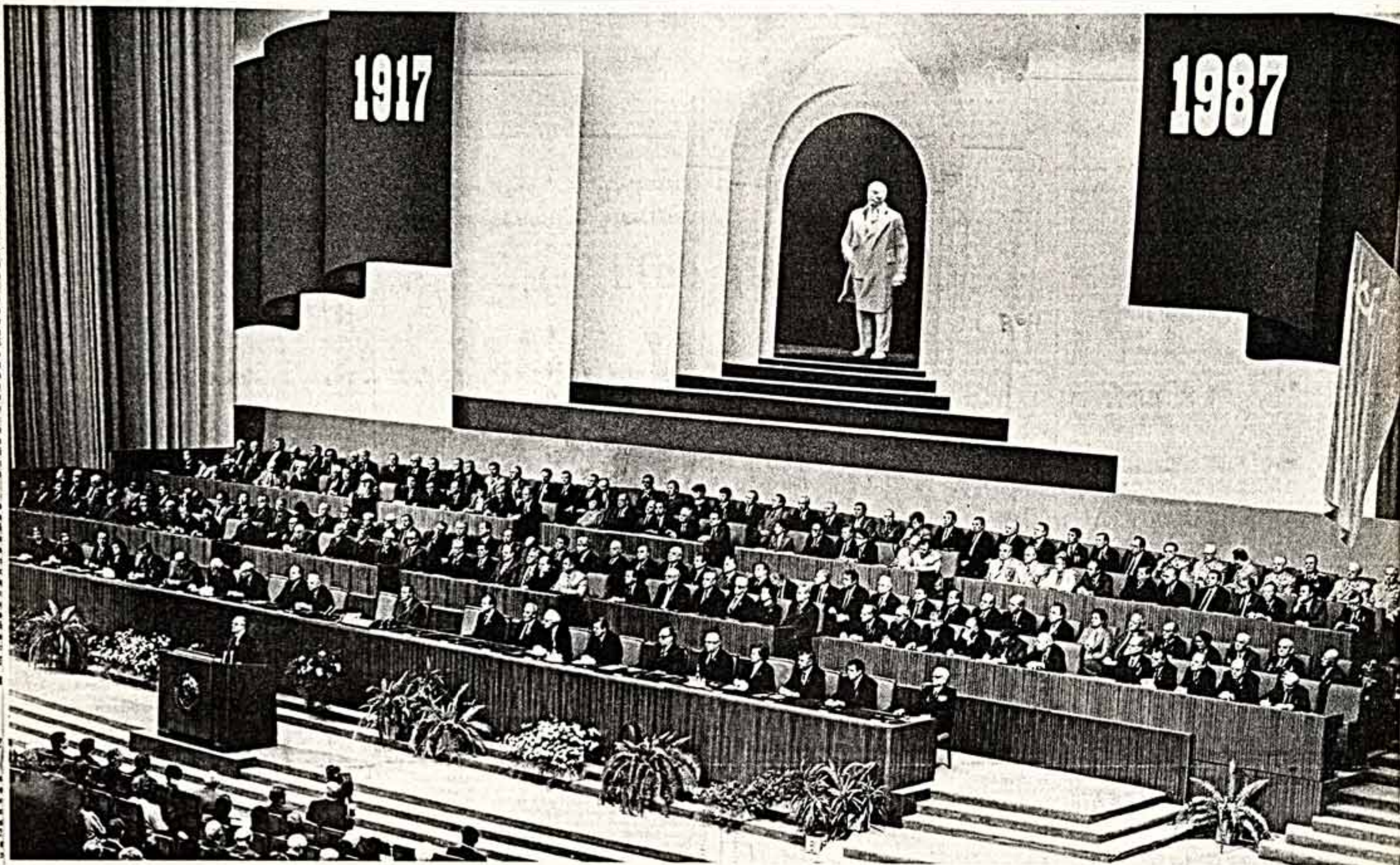
Торжественное заседание в Кремлевском Дворце съездов. На трибуне — Генеральный секретарь ЦК КПСС М. С. Горбачев.