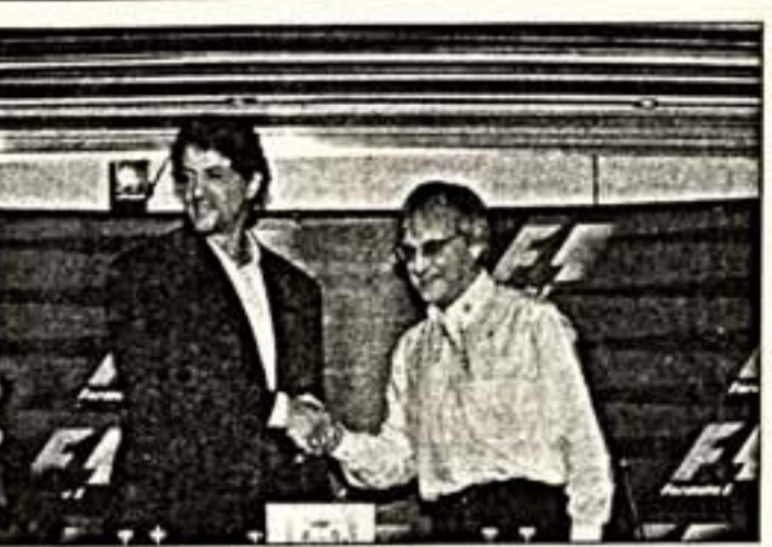
Так два года назад рукопожатие Сильвестра Сталлоне и Берни Эклстона скрепало решение о создании фильма о "Формуле-1"