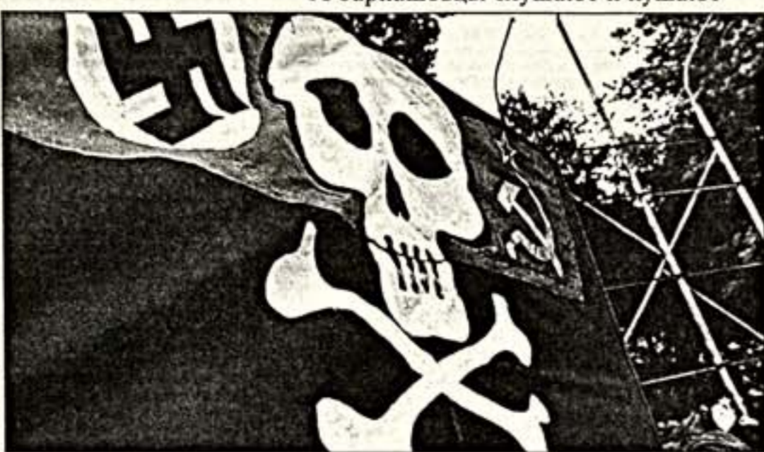
А баркашовцы слушают и кушают