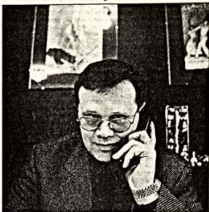
Беседу вел Ирина АЛПАТОВА