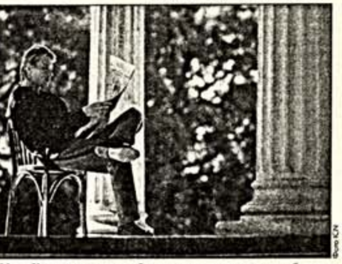
Мика Хаккинен может себе позволить немного расслабиться

Бронечем, работы хватает не только командам и гантелям. Имя Берни Эклстона, создателя могущественной империи, владеющей эксклюзивными правами на проведение гонок "Формулы-1" во всем мире, сегодня регулярно появляется на страницах деловых хроник. Причина — попытка размещения акций этой компании, купив которые любой из болельщиков мог бы вложить свои деньги в столь прибыльный бизнес, как "Формула-1". Казалось бы, эта благая идея должна найти всеобщую поддержку. Но не стоит торопиться с выводами... Власти европейских стран еще очень хорошо помнят все попытки господина Эклстона по выкручиванию рук цыганьих государству, когда какие-либо решения не устраивали его эгоистичного "формулического" магната. А возможность для шанца у него была более чем серьезная. Как только государство (как это было во Франции) пыталось вмешаться в распределение телевизионных на "Формулу-1", как тут же следовал грозный окрик, сопровожда-