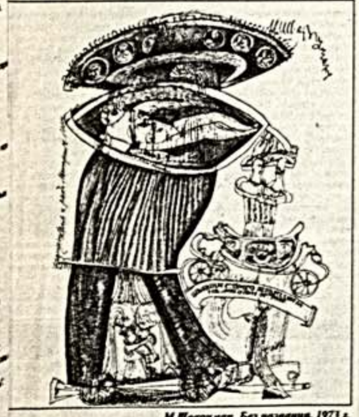
М.Шварцман. Без названия. 1973 г.