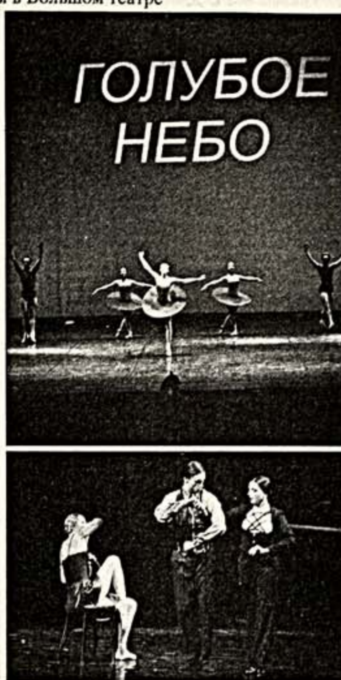
Вверху: сцена из балета "Улоение точностью". Внизу: сцена из балета "Урок"