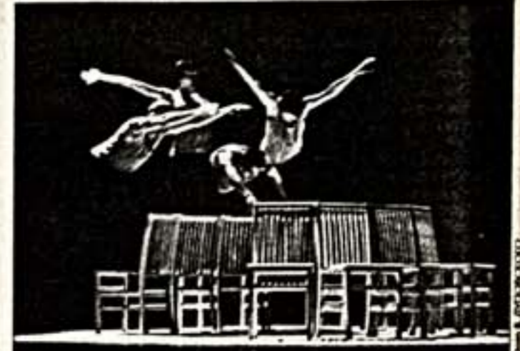
Сцена из балета "Компас"

Когда видишь порой более чем наземные постановки представителей этого направления, надеешься, что был малейший, отдельные штрихи и находки молодых впоследствии сумеют превратить более одаренные люди. Процесс взаимобогащения неизбежен, если человек открыт всему тому, что бурлит вокруг.