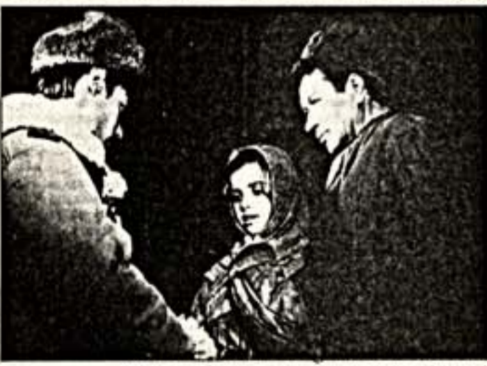
Л. Быков в фильме "Аты-баты, шли солдаты..."

Мы живем в удивительное время. Если верить тому, что теперь говорят СМИ, никогда в нашей стране не было так много великих людей. Мы живем в окружении "великих" певцов, которым микрофон и драматические жесты заменяют голос; "великих" композиторов, сочиняющих одну и ту же музыку, в которой главный инструмент — барабан и которую народ окрестил точным словом "золотой локот"; "великих" живописцев, на полотнах которых трудно отличить корову от унитаза и попытаться хоть что-нибудь извлечь из их "темных прозрений"; "великих" писателей и поэтов, юные коты не читают, кроме авторов и членов комитетов бесчисленных премий; и даже "великих" патриотов и граждан, для которых родина — это возможность за