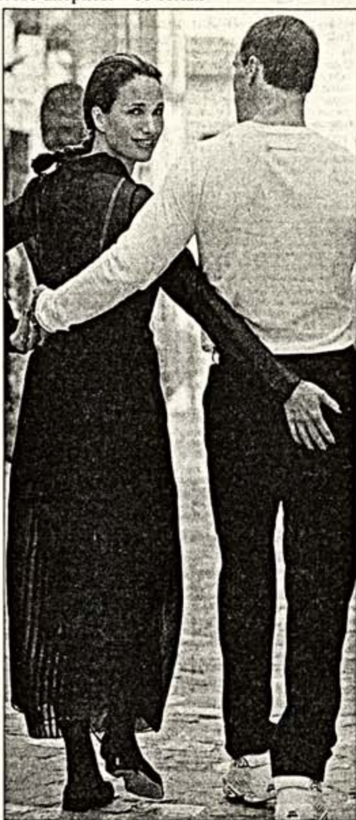
Энди Макдауэлл с мужем Полем Кейли