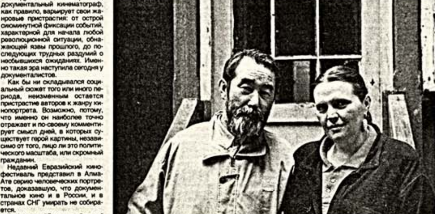
Кадр из фильма "Дом на обочине"

Документальный экран евразийского пространства