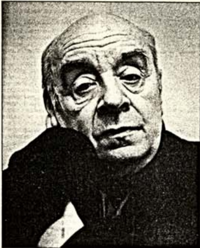
Леонид Броневый в свои семьдесят