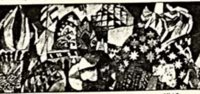
А. Лестуков. "Василий Блаженный" (фрагмент)