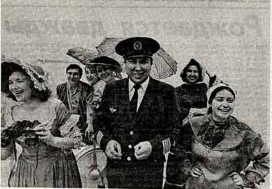
Коллектив Тобольского драматического театра на летние гастроли отправился на теплоходе. По большому и малому рекам артисты доберутся до глубинных Тюменской и Омской областей, туда, где трудятся геологи и рыбаки, оленеводы и габодетский, нефтяники, лесорубы, строители. В каждую свою театральную кампанию тобольский театр показывает более 200 спектаклей.