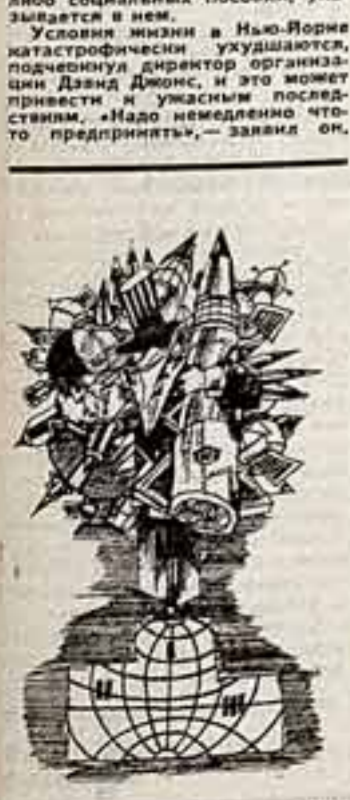
ВПК США — чемпион вооружений. Рисунок Изабелло Нинова (ИРВ).