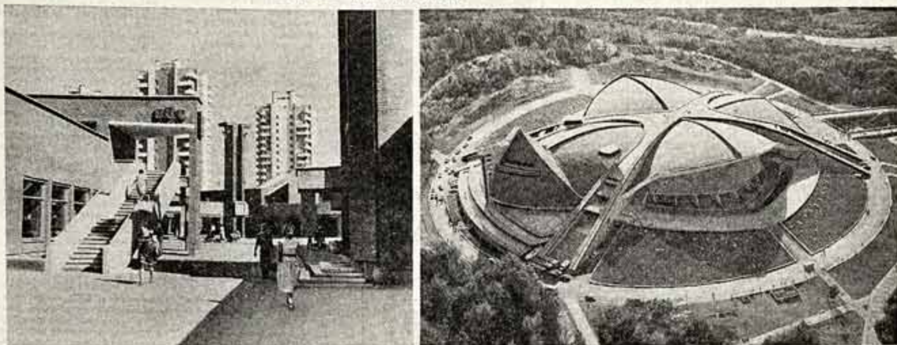
Общественно-торговый центр «Шешкина» в Вильнюсе. (Архитекторы — Н. Памла, Г. Рамунис, Г. Диндене, Г. Баранас, Инженеры — Ц. Стримантис, А. Вашиновичес). Спортивно-концертный комплекс в Ереване. (Архитекторы — Н. Анилин, А. Тарханян, С. Хачинян, Г. Логоски, Г. Мушеги, Конструкторы — И. Цатурян, Г. Азизян). Общественный центр села Петровка района «Дружба народов» Крымской области. (Архитекторы — В. Красильников, Д. Болоня, Инженеры — Л. Голубов, Г. Кальчук).

СЕГОДНЯ ОТКРЫВАЕТСЯ VIII СЪЕЗД АРХИТЕКТОРОВ СССР