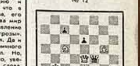
Мат в 2 хода.