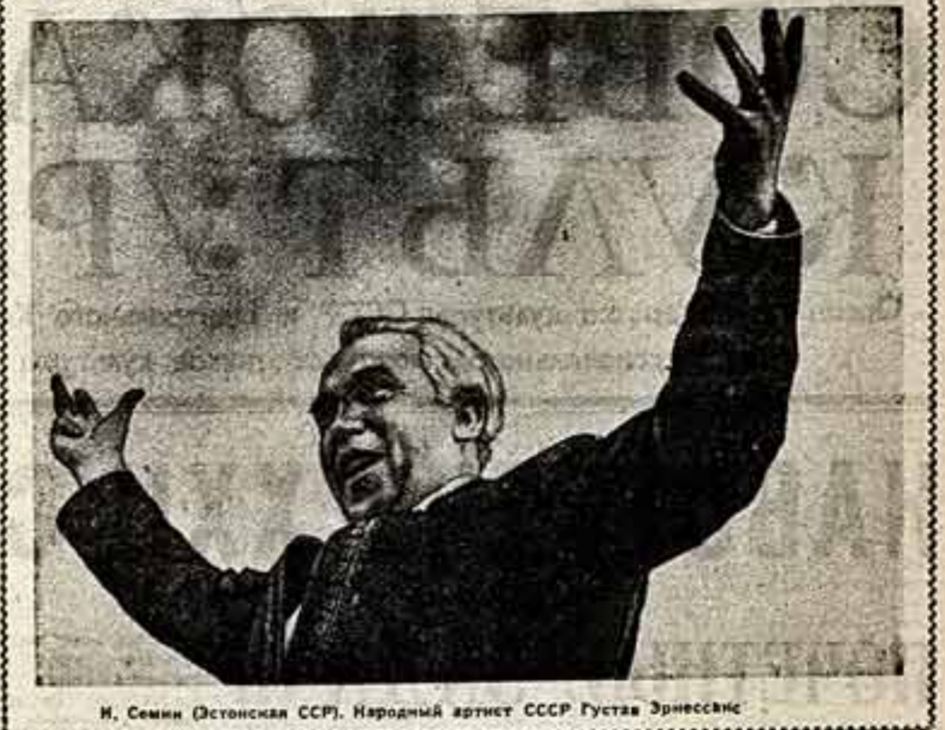
М. Семин (Остонская ССР). Народный артист СССР Густав Эрнестин