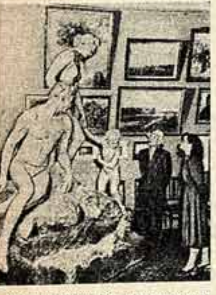
Ростов-на-Дону. В выставочном зале Союза советских художников экспонировалось 100 произведений живописи, графики и скульптуры. На снимке: в одном из отделений выставочного зала.