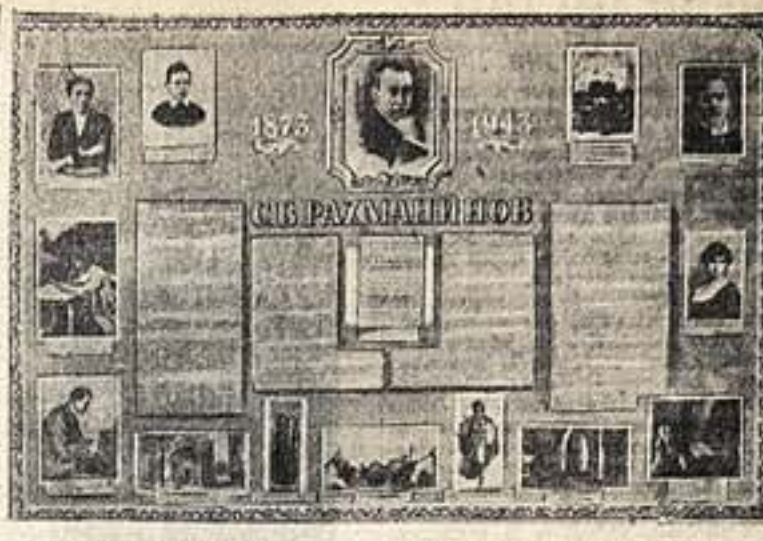
Портрет С. В. РАХМАНИНОВА. Выпущена издательством «Искусство»