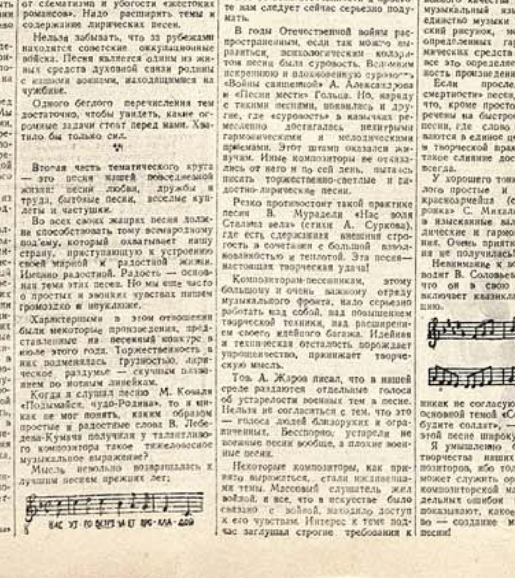
И. ДУНАЕВСКИЙ ПОЭТ и КОМПОЗИТОР