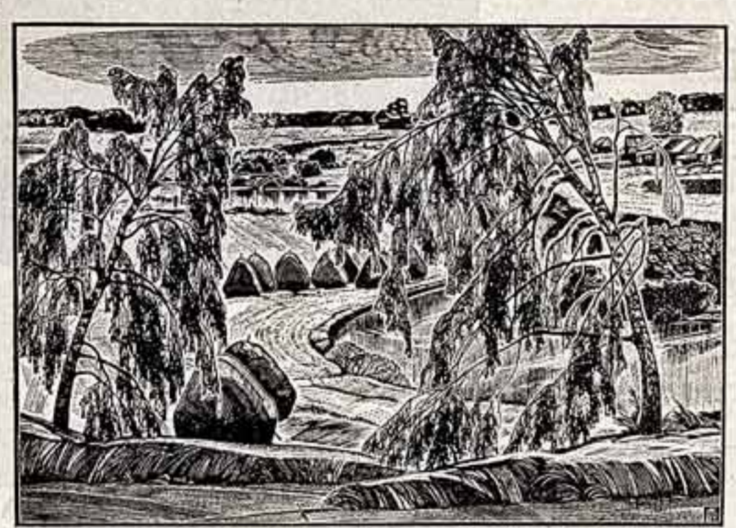
А. КОЛЧАКОВ. «Сенокос». (На серии «Жизнь кировакая».)

Особый интерес вызывают, конечно, самые ранние произведения искусства, созданные человеком, верхнего палеолита в период, начавшийся на территории Франции примерно тридцать тысяч лет назад. Глядя на полные силы и движения, рельефно вырезанные в известняковом блоке фигуры двух сошедших в поединке козлов из гrotto дю Рон, трудно представить, что эти великолепные скульптуры изваяны мастерами каменного века.