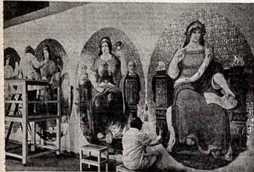
Дрезден с любовью восстанавливает знаменитое творение немецкого архитектора Готфрида Земпера. Здание жесткого оперного театра было разрушено в феврале 1945 года в результате бесцельной англо-американской бомбардировки города.