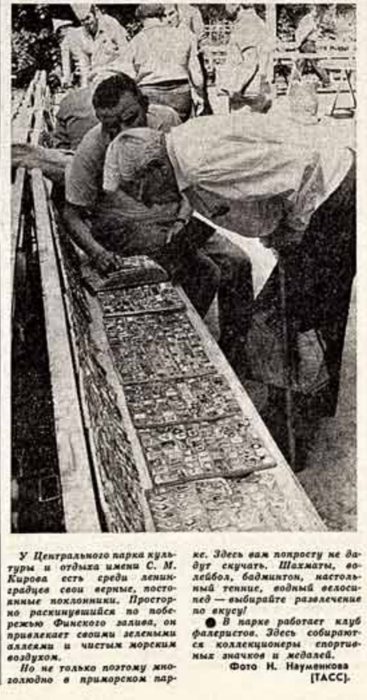
У Центрального парка культуры и отдыха имени С. М. Кирова есть среди ленинградцев свои верные, постоянные поклонники. Просторно раскинувшийся по набережной Финского залива, он привлекает своими зелеными аллеями и чистым морским воздухом.