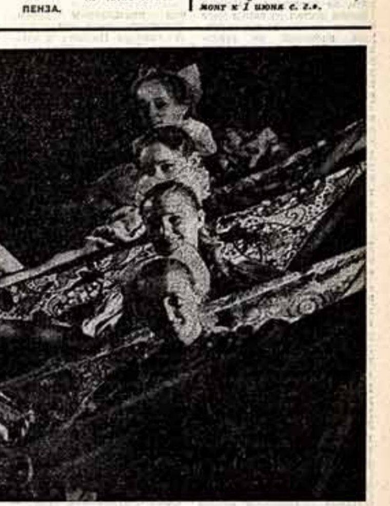
В Бельгии начались гастроли ансамбля русского народного ансамбля песни и танца. Стремительными темпами развивается культурно-просветительная работа восточных регионов, и это бурное развитие жизни нашло свое отражение в характере танцев ансамбля русского народного ансамбля песни и танца. Стремительными темпами развивается культурно-просветительная работа восточных регионов, и это бурное развитие жизни нашло свое отражение в характере танцев ансамбля русского народного ансамбля песни и танца.

«Торжественная обстановка, провинциальные слова старого земляка до глубины души взволновали присутствующих, особенно молодых рабочих, побуждая их еще выше оценить роль механизатора в сельскохозяйственном производстве».