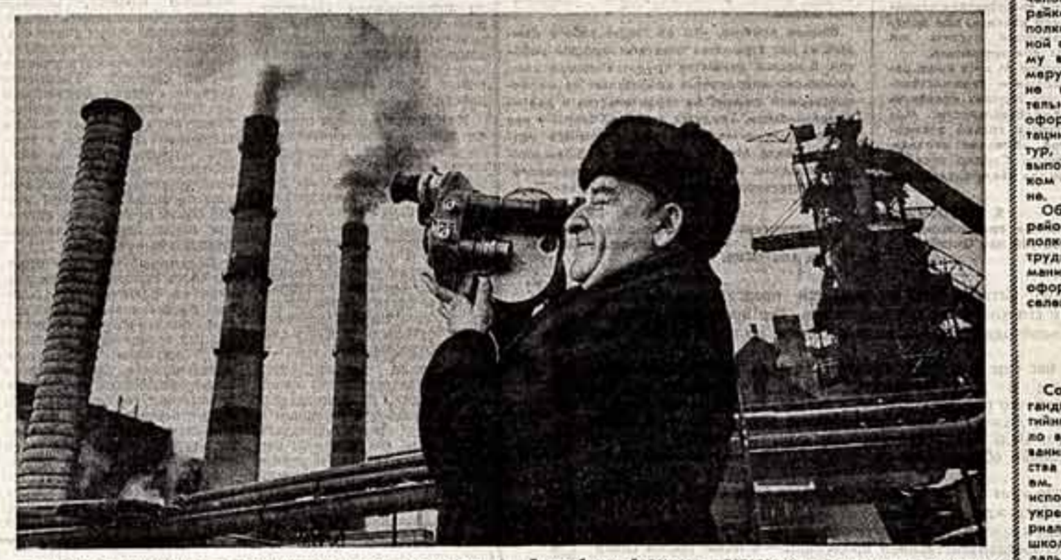
Герои будущей ленты — передовики производства, решившие досрочно выполнить государственное задание и социалистические обязательства 1973 года.