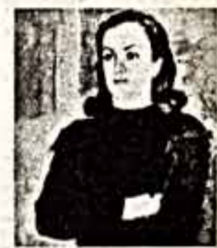
К. Мадонна Джаларидзе. Портрет Мадон Джаларидзе.

Развалилась страна. Таперь Грузия — уже граница. Но разве не остается вечными категориями красота женщины, одухотворенность актрисы, волшебство искусства? Остаются. И для скольких людей, интуиция за границей, недавно еще бывшая впереди условных, все эти понятия ассоциируются с именем прерванной грузинской актрисы Мадонн Джаларидзе, у которой сегодня юбилей.