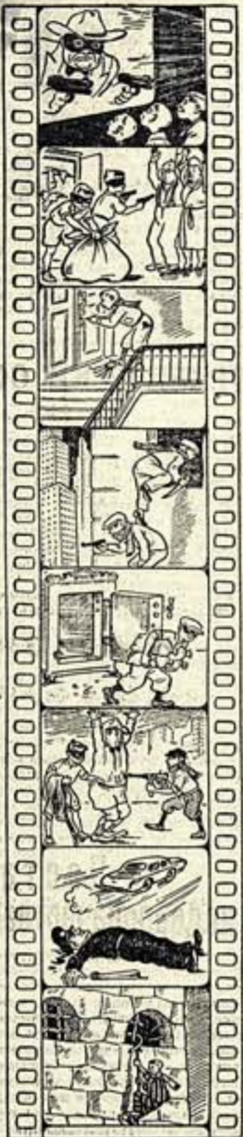
Рис. А. Орлова.

На ответы, присланные более «надеждопробуждающим» зрителем свидетельствует о том, что подобными произведениями в квартиру для них — привычный этап. Их заинтересовали вопросы, связанные с самим процессом образования. Например, «как применять афор для ускорения обитателей», «как при образовании пользоваться перчатками», «как отсканать тайные ящики» и т. д. Весьма познавательно, что «привычные» больше всего интересуют «проблемы», как организовать ограбление «взвешивая» магазин».