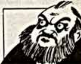
Кинорежиссер В. Делия. Дружеские шаржи К. Валова.