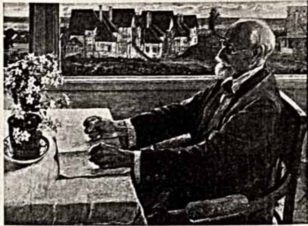
И. П. Павлов

Переписка академика И. П. Павлова с В. М. Молотовым