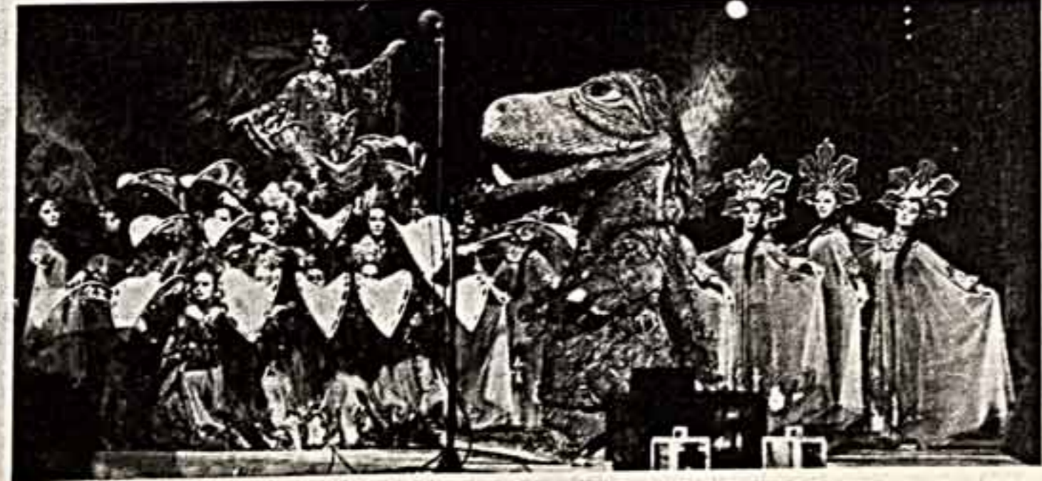
Сцена из концерта-спектакля.

Яркий, красочный концерт-спектакль «Прощай, дилан в год, обреченный на завоевание шлоуэнкал, с успехом прошел в Государственном Центральном концертном зале (режиссер-постановщик Г. Белов). И хотя в этом представлении не участвовали Дед Мороз и Снегурочка, очутившиеся в новогодней обстановке, эту ситуацию оживил артист. Этому способствовали чудесные декорации, световые эффекты и участие золотого детства — сказочные персонажи. Все они работали очень качественно. Но «Прощай, дилан в год» — это прелюдия и для взрослых — прекрасная музыка, песни, танцы, цирк, где родилась и мастерски спелая участница мастера вступила, имея исполнительский опыт городов страны.