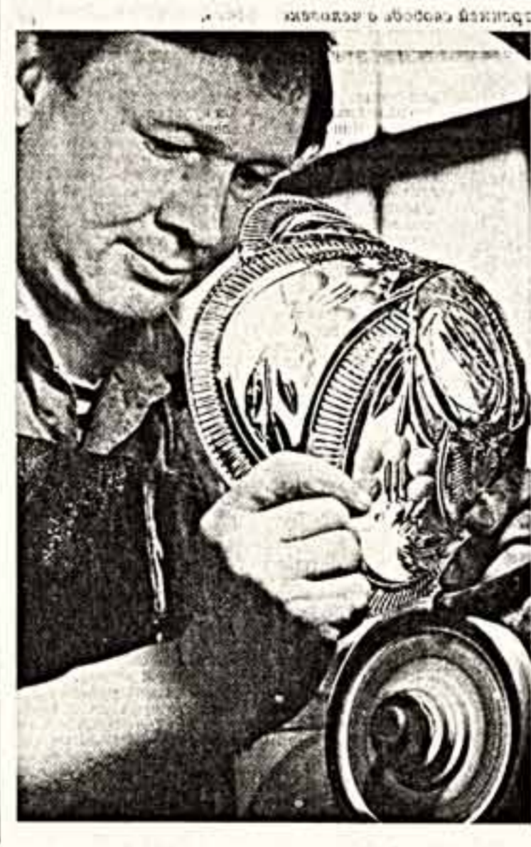
Назидание денпградскому кооперативу «Гута» вел старший метод ручной работы с горячим стеклом, при котором мастера сложными приемами изгибают изделия из хрустала как прозрачное, так и окрашенное в разные цвета.

Министерство СССР рассмотрело статью «Ржавые жернова», опубликованную в газете «Советская культура» от 21.11.88 г., и сообщает: Совет Министров СССР установил срок ввода мощности 1-й очереди Красноярского горно-обогатительного комбината в 1992 году, в окончание строительства и ввод комбината на полную мощность — в 1994 году. В период до 1992 года включительно в г. Долгинская будет построено для трудящихся комбината в соответствии с проектом 348 тыс. кв. метров жилья домов и общежитий, 7 детских садов, 3 школы и другие объекты. Первые детский сад и школа будут построены уже в 1989 году. Строительство административных зданий, Дома культуры, Дома пионеров и спорткомплекса перенесено на 3-ю очередь [1993—1994 гг.] в временный культурный центр пока будет кинотеатр на 800 мест, который будет построен в 1992 году... Л. АНТОНЕНКО, заместитель министра.