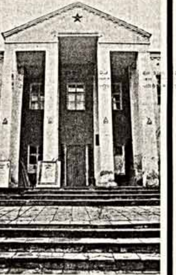
Безлюдье и гуляка тишина — непременные атрибуты любого сколько-нибудь приличного заколдованного замка.