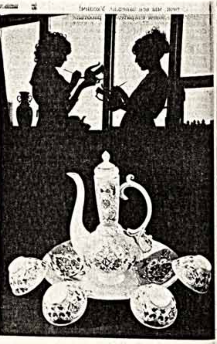
Коллектив Турсуладского фарфорового завода Таджикской ССР расширяет ассортимент выпускаемой национальной посуды. Спрос на эти изделия известен далеко за пределами республик. Покупатели привлекают изящество форм, яркость и чистота красок орнамента изделий таджикских мастеров. Продажи интересны и продукция завода для зарубежных фирм. Вы видите одну из новинок завода — чайный сервиз «Зуфра».