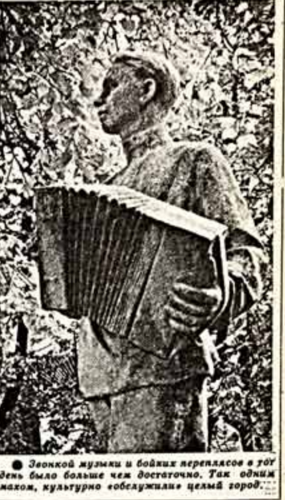
Занкой музыки и бойких перепалок в году день было больше чем достаточное. Так одним махом, культурно «обслужили» целый город...

Вдумаемся в социальную суть происходящего. В стране миллионы работников клубов и библиотек. И в большинстве своем они заикаются существующим порядком.