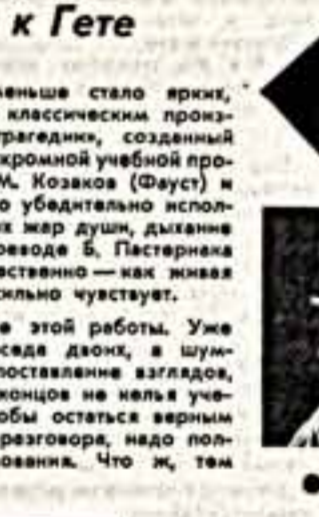
Сцена из спектакля «Фауст».