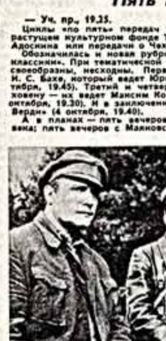
Кадр из фильма «На крутизне».