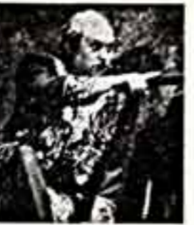
Еще никто до конца не знает, как пойдет нынешний театральный эксперимент...