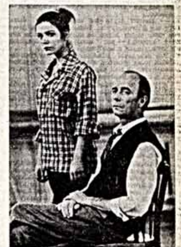
Фикация духа, к тому, чтобы не комплименты и прихлебатели, а истинные таланты с характером, волей и совестью определяли тон нашей жизни, становилась — всегда и во всем — ее главной движущей силой.

В наше время вопрос о действительности доброты, о том, чтобы отдал жизнь все лучшее, что есть в душе, встает с новой силой. Фильм Тодороского современен и в этом смысле. Бытовая история перестраивает свои рамки. Решившая социальную, она приобретает широкую поучительность. Можно было бы сказать так: фильм сделан по принципу: два писателя, три в уме. Эти трое связывают драму несостоявшегося композитора с процессами, которые происходят в обществе, становятся уроком правды, призывом к интенси-