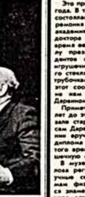
Эта прощание 19 июля 1912 года в тот день в Кембридже состоялось торжественное церемония посвящения русского академика Павлова в почетные доктора университета. И во время ее хором пропел гимн президенту, один из студентов слушал на веревочке игрушечную собачку, утешивая грубочка-фистульки. А был этот сообразительный студент не кем иным, как Чарльзом Дарвином — ученом ученого. Примечательно, что за много лет до этой встречи в том же зале старинного Кембриджа и сам Дарвин во время церемонии вручения ему почетного диплома получил от студентов того времени на память игрушечную собачку.

19 июля 1912 года великий русский физиолог Иван Петрович Павлов получил подарок — игрушечную собачку. Без приглашения можно сказать, что этой белой с черными глазами собачка выпала редкая судьба. Купленная в обычном игрушечном магазине более сорока лет назад, она стала музейным экспонатом мемориальной выставки академика Павлова в Ленинграде, в здании на углу 3-й линии и набережной Лейтенанта Шмидта.