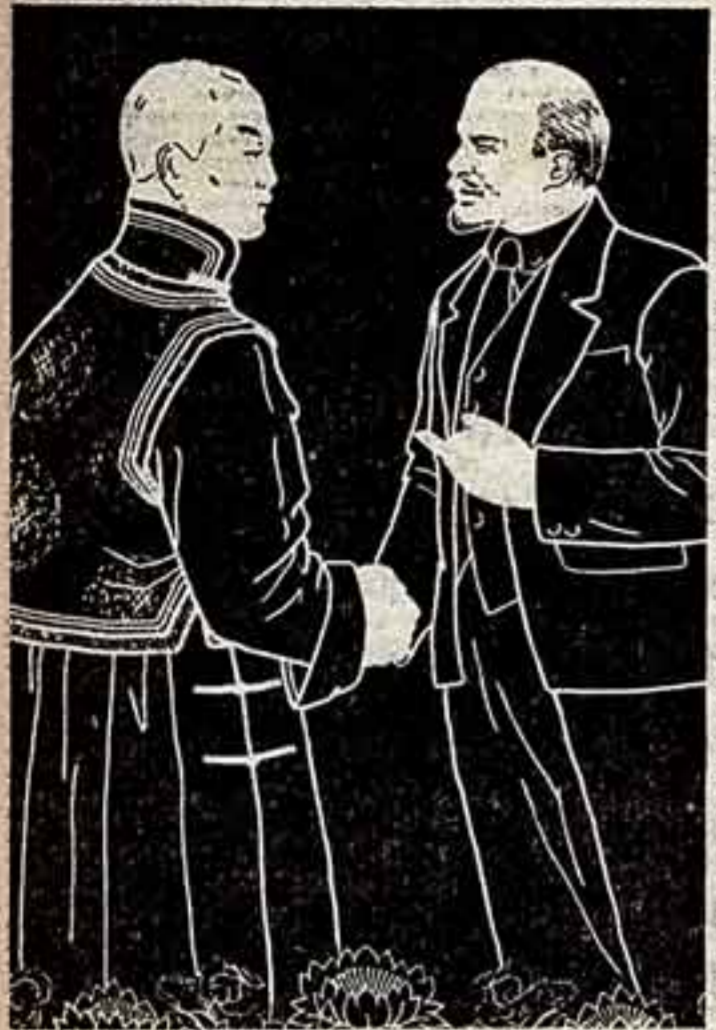
Б. Норолхо. «Встреча» (Вышивки).