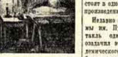
Из иллюстраций художников Курьяникова к повести Н. В. Гоголя «Шинель».