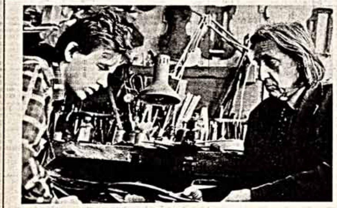
Табла все время не покидает ощущение чужда, происходящего в этой комнате: здесь за столом, из нескольких кусков мертвого дерева позависает на свет скрипка. Талантливый музыкант возмает ее в руки, и она рассказывает о радости и страданиях, о горе и счастье.

Началось с того, что в Каунасе нас не встретил экскурсионный автобус. Оказавшись, он сломался. О другом, как нам повезло, и думать нечего. Как ничего думать и о гостинице.