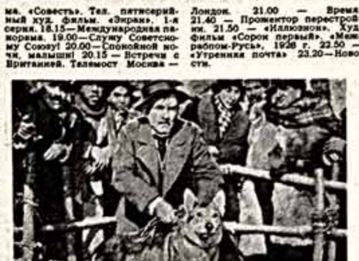
— образовательная пр. 21.40 Кадр из фильма «Белый камень».