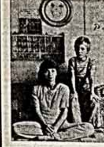
Этапы о художниках