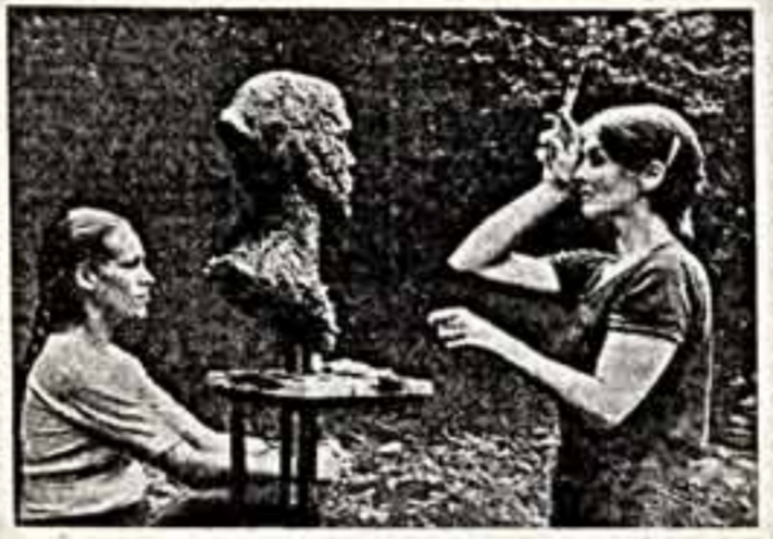
Этапы о художниках

Так называлась фотоэкспозиция, проходившая недавно в Берлине. На ней были представлены 80 портретов известных балерин, актрис, художниц ГДР.