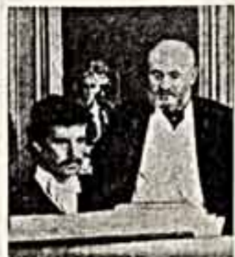
Генеральный секретарь ЦК НДПА Наджиб.

Мы, сказал Наджиб, пришли наконец к осуществлению великой мечты народа — избранию людей от интеллигенции и отсталости полководца, отсталости своей родины от всех империалистических держав.