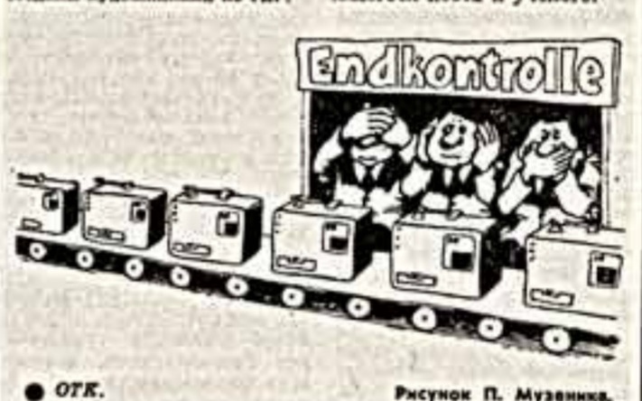
Рисунок П. Музыкина.

— Каждый сезон, — продолжает М. Хэррисон, — приходится иметь репертуар. Сейчас мы можем показать около 20 различных спектаклей, однако я не думаю, что у нас есть для зрителя. Объясняется это довольно просто. В большинстве городов Среднего Запада, или как порой называют этот регион, «средней Америке», не так много иммигрантов из Европы, в частности из Италии, для которых опера — составная часть культуры. Опера для иммигранцев, будем откровенны, едва ли есть насущной. Этот вид искусства в Америке нов и неустойчив.