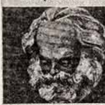
Карл МАРКС — мой прадед

Социалистический Республик, являющийся надеждой народов всей планеты, непоколебимой опорой мира... Ты сумел претворить в жизнь действительность в научные предвидения и гуманистические идеалы, рожденные трудом и гением великого мыслителя-революционера К. Маркса, Ф. Энгельса, В. И. Ленина».