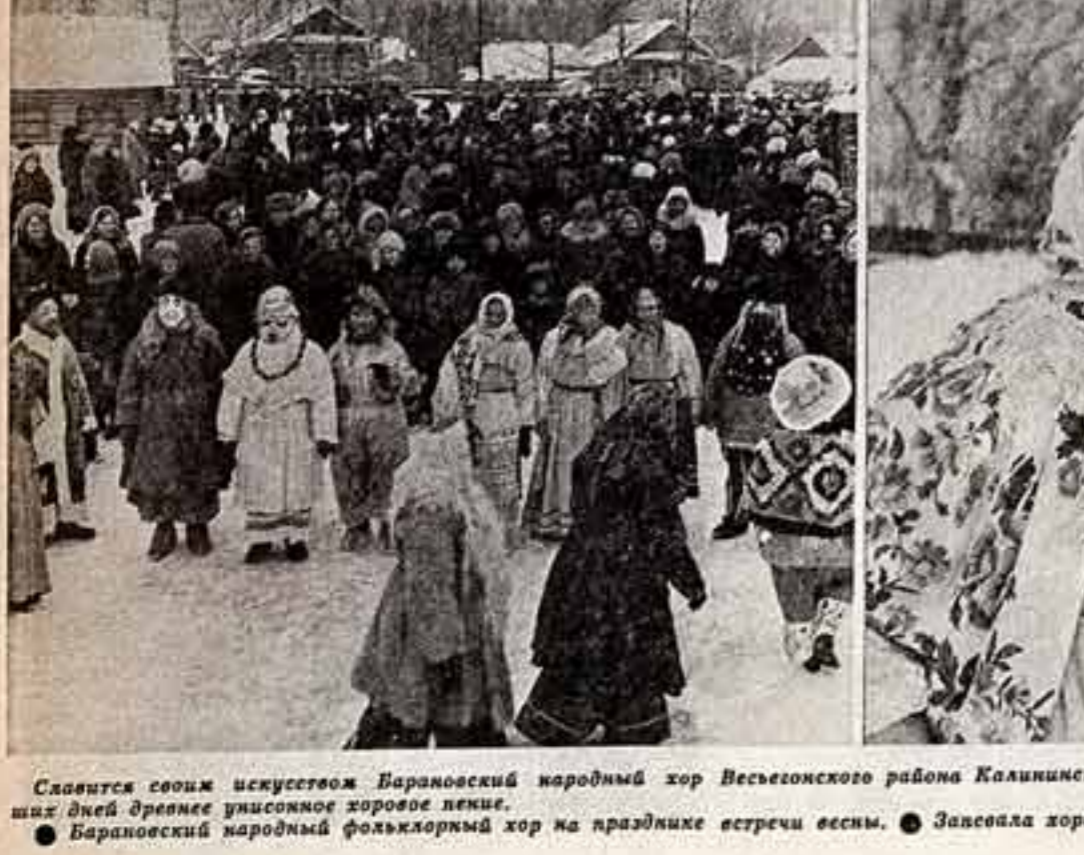
Славятся своим искусством Барановский народный хор... Барановский народный фольклорный хор на празднике встречи весны.