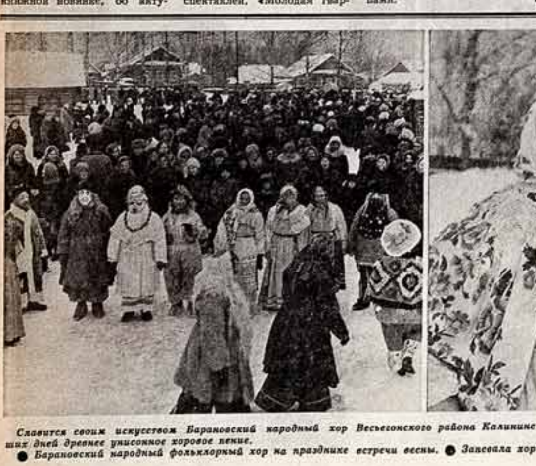
Славятся своим искусством Барановский народный хор... Барановский народный фольклорный хор на празднике встречи весны.