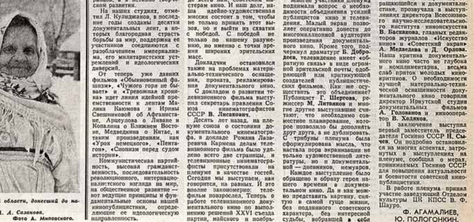
Весьегонского района Калининской области, донесший до наших дней древнее искусство хоровое пение. Засеивает хора А. А. Саломова.