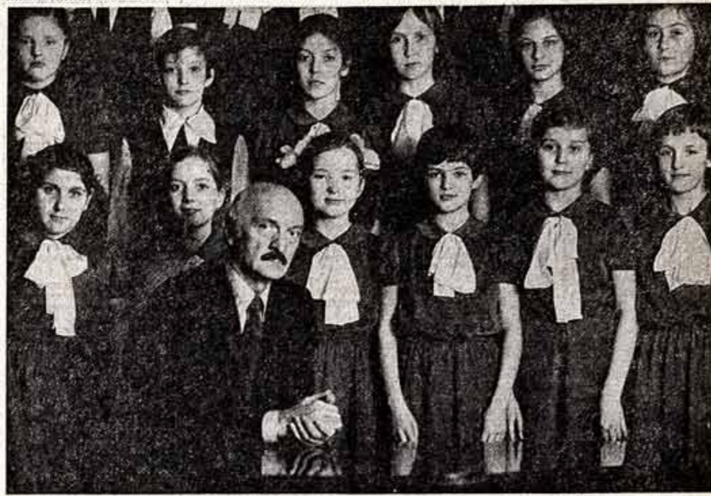
— ПРЕДЛАГАЮ ОБСУДИТЬ —