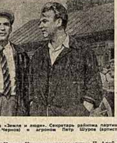
Кадр из фильма «Земля и люди». Секретаря района партии Попов (артист П. Чернов) и агроном Петр Шуров (артист А. Егоров).