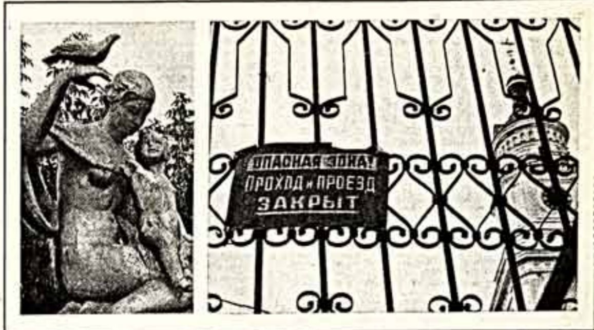
Может ли исполном поручить разработку проекта группе талантливых зодчих? Не может. Вот и приходится мыться с документацией на разбойный уезд, илячяный проект котельной.

В былые времена в Волоколамске ежегодно приезжали по несколько сотен полномоченных — кто-то по мясу, кто-то по молоку, кто-то по картофелю, кто-то по льну. Каждый что-то писал, считал, учитывал. Но ни разу не было упоминания по качеству жизни горожан. А качество такое. Школы переполнены —