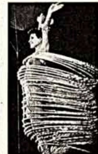
Фрагменты праздника в Московском дворце молодежи.