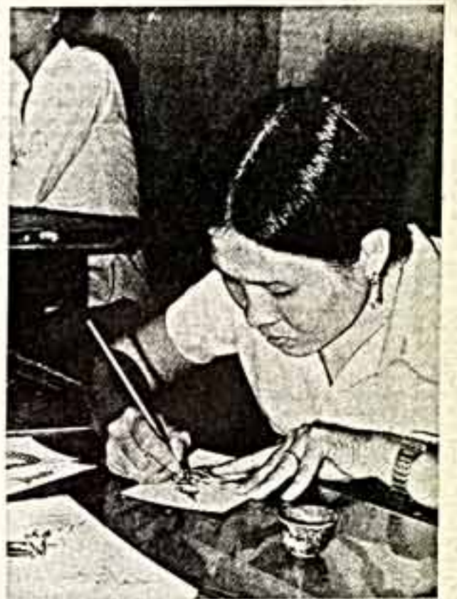
Десять лет минуло с того дня, когда был свергнут кровавый полуголодный режим, принесший неисчислимые страдания народу Кампучии. В светлые с реакцией народы встала, победы, ныне строит новую жизнь.

что время от времени возникают чисто организационные трудности. Объективное объяснение тому есть: интеграция нашего культурного сотрудничества в последние годы приобрела настолько широкий размах, что некоторые причастные к этой деятельности службы чисто административно-материального направления не успевают, а порой и не умеют толково, грамотно организовать работу. Министерство культуры СССР не снимает с себя причастности к решению этих проблем и настойчиво стремится к тому, чтобы пролонгировать культурного обмена с СФРЮ и другими братскими странами без досадных промахов в этом отношении.