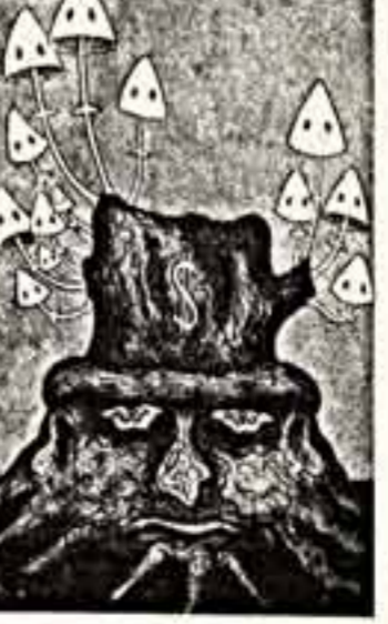
М. Абрамов. «Настоящая игра бюрократов». М. Абрамов. «Детище знают себе цену». А. Андреев. «Расцвете поляны».