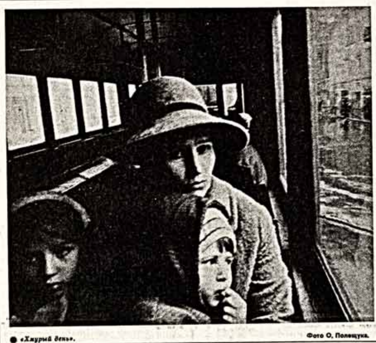
«Журный день».

— Сотни тысяч разводов — это, конечно, очень много, но ведь это — наша часть семьи. Большинство же ничего подобного не грозит. Однако то, о чем вы говорите, относится ко всем. По-