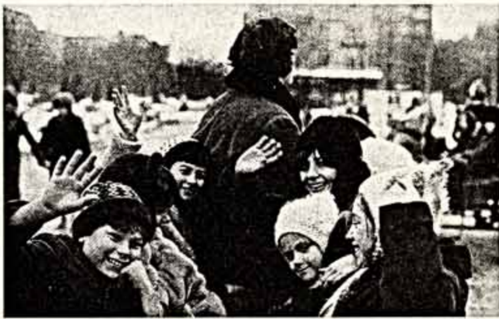
Подходит к концу зимние школьные канкулы. Впереди у ребят напряженная третья четверть. А пока веселье, смех и радость последних январских представлений.