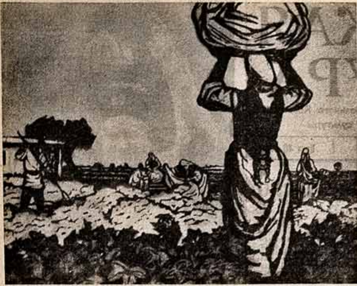
Л. Иванов. «Сборщики». Из серии «Слова о киргизской женщине». Литографера.