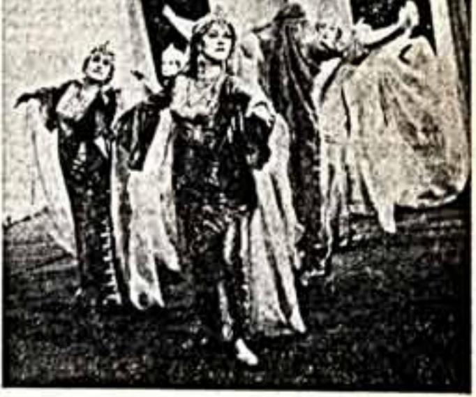
Ансамбль «Забон» — молодежный этнографический коллектив Госакадемии Таджикской ССР — пользуется популярностью не только в республике, но и во многих странах мира.