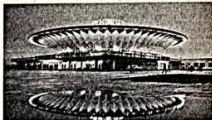
Здание соцпарка в Душанбе.