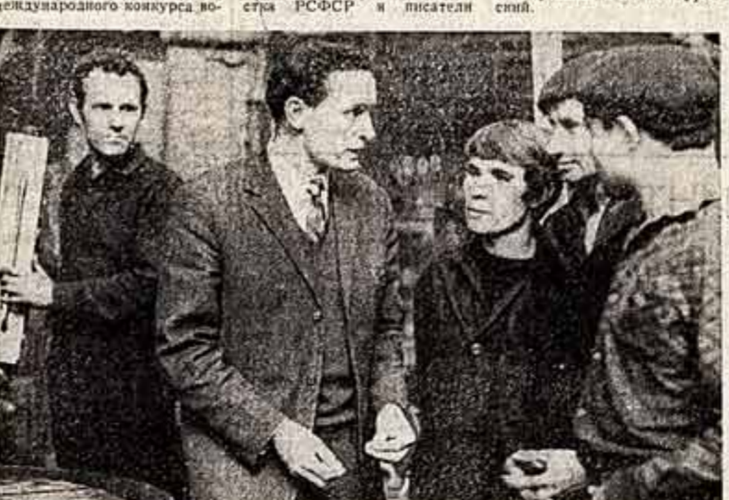
Рабочие московского завода «Динамо» выдвинули своих кандидатов в депутаты в Пролетарский районный Совет. Среди них и актер Театра им. Евг. Вахтангова, заслуженный артист РСФСР Василий Лановой.