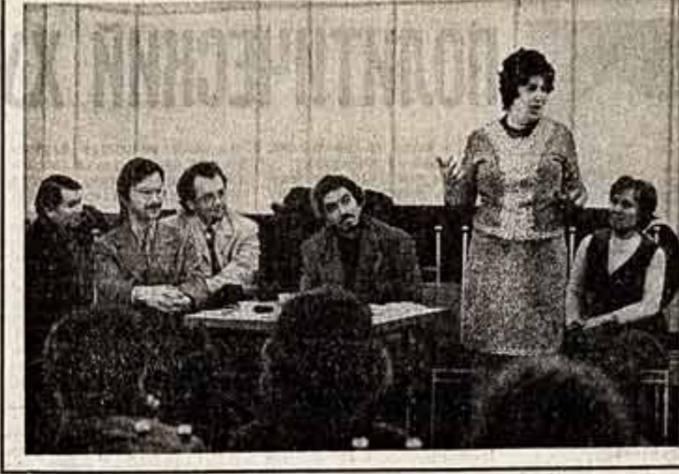
После премьеры участники спектакля встречались со зрителями. Наталья Сац рассказывает им, как рождался опера «Три толстяка».