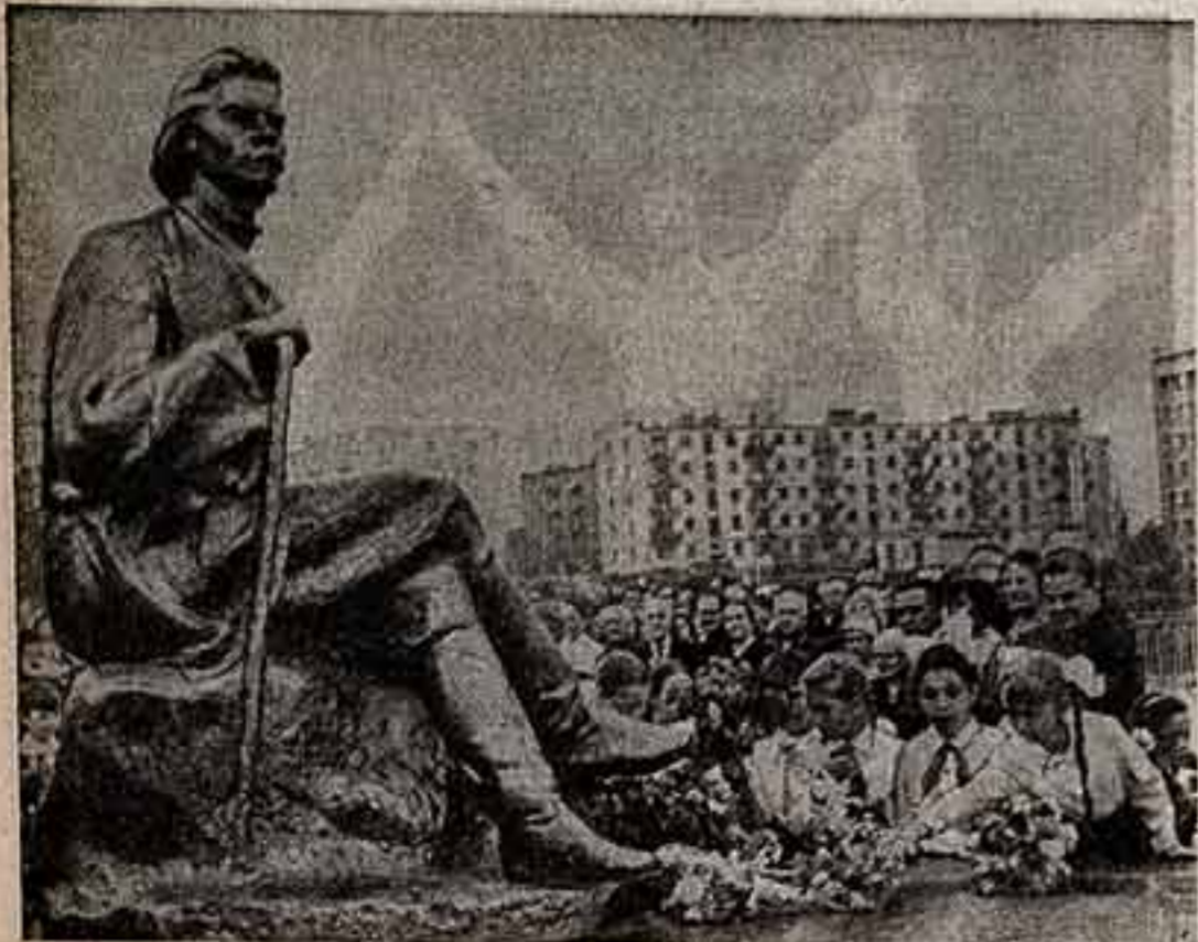
Скульптура Наны Шалуниной «Горький на Волге естественно»... Открытие этого памятника велось кулаками традиционных горьковских дней культуры и искусства...