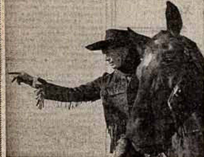
Исполнитель главной роли в картине актер Олег Видов рассказывает.

После знаменитой книги Дэвида Дефо о приключенных Робинзона Крузо, экранизированной на Одесской киностудии, другая знаменитая книга нашего детства обрела свое кинопродолжение. Фильм «Всадник без головы» по одноименному роману Майн Рида на киностудии «Ленфильм» поставил кинорежиссер В. Вайночкин. Один из старейших деятелей советского кино, автор знаменитых кинолент 30-х годов «Дети капитана Гранта» и «Остров сокровищ».