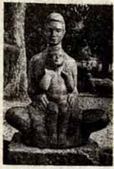
Г. ГРУНДБЕРГ. «Мир, гранит»