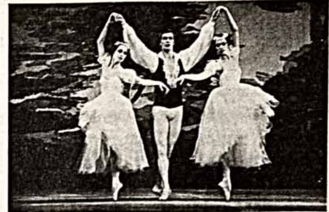
В рамках всесоюзной недели «Театр — детям и молодежи» Муниципальный театр имени К. С. Станиславского и Ва. М. Немировича-Данченко для концерт старинной и классической хореографии. Зрители были учащиеся профессионально-технических училищ города Москвы.

Ю. ПОЛОГОНКИН, (Наш спец. корр.), ЮРМАЛА.