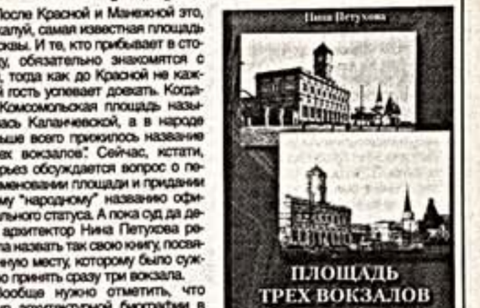
Площадь трех вокзалов