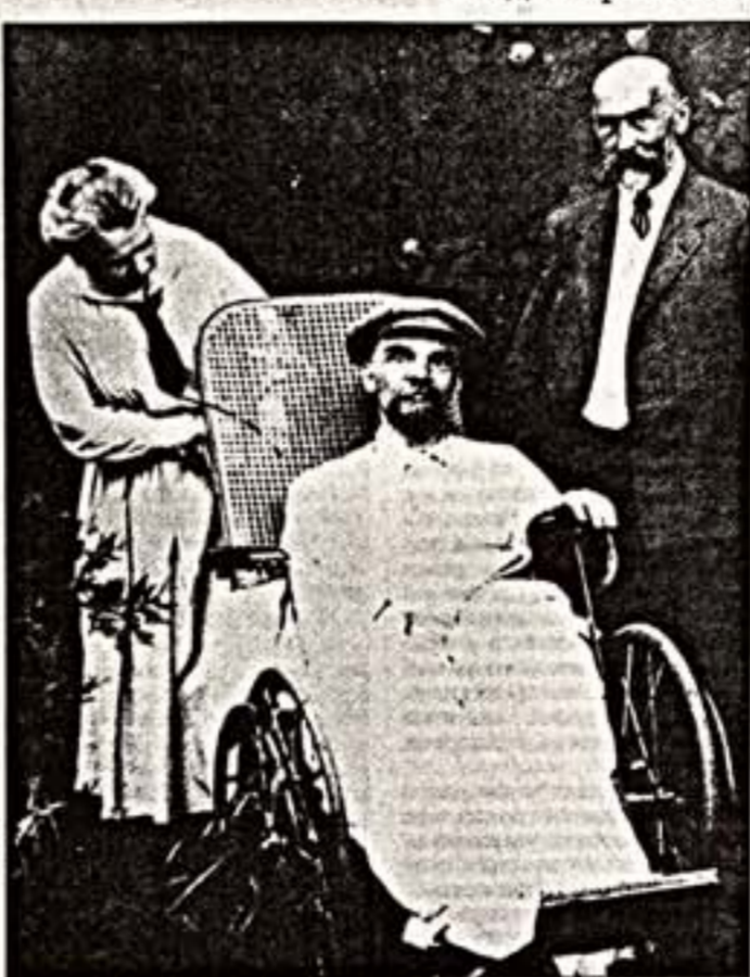
В. Ленин в Горках. 1923 г.

"В январе не стало друга всех трудящихся земли", — возглас раздался по всей стране. Это был Владимир Ленин. Он умер 21 января 1924 года.