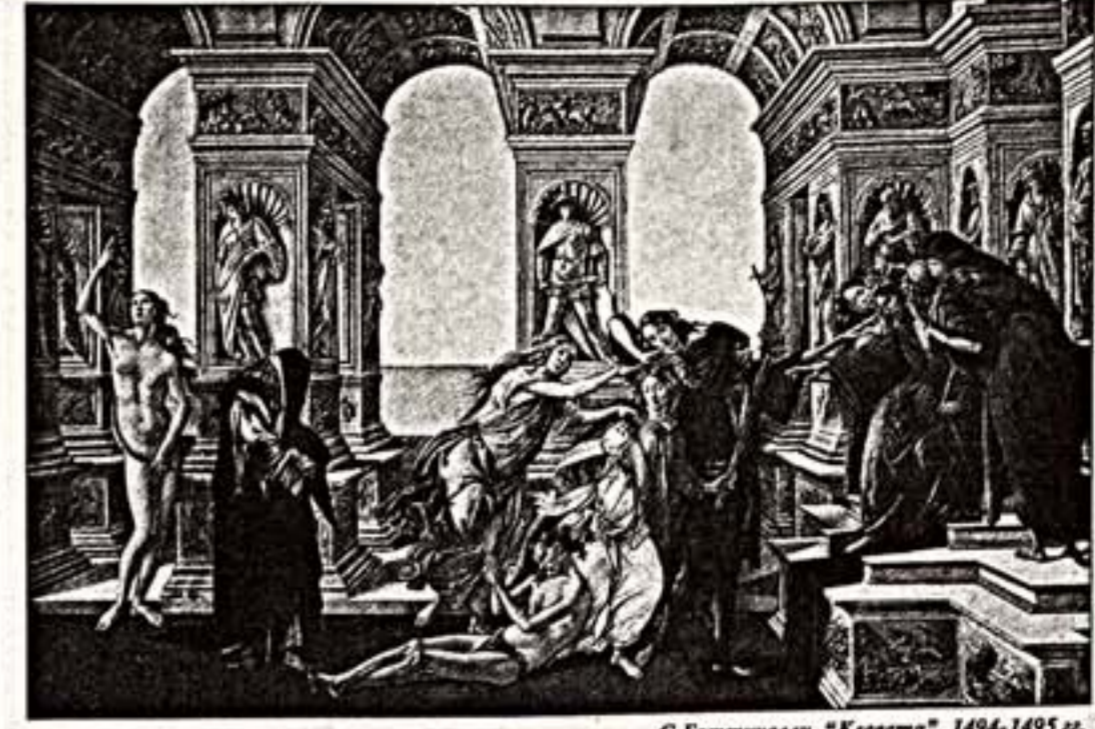
С.Боттичелли. "Клевета". 1494-1495 гг. Искусство конца XIX - начала XX века. Он в полной мере представил почти все основные направления...

Итальянское искусство, что дает весьма многогранительный ряд. Например, "Портрет Пушкина" Тропинина и "Портрет Уго Фосколо" Фабри...