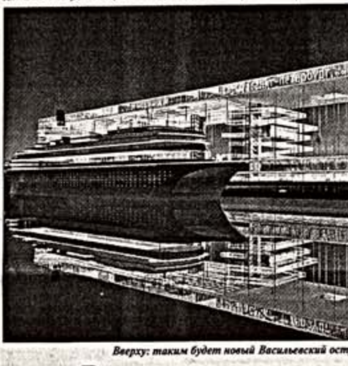
Вверху: таким будет новый Васильевский остров. Внизу: проект "Окно в Европу"