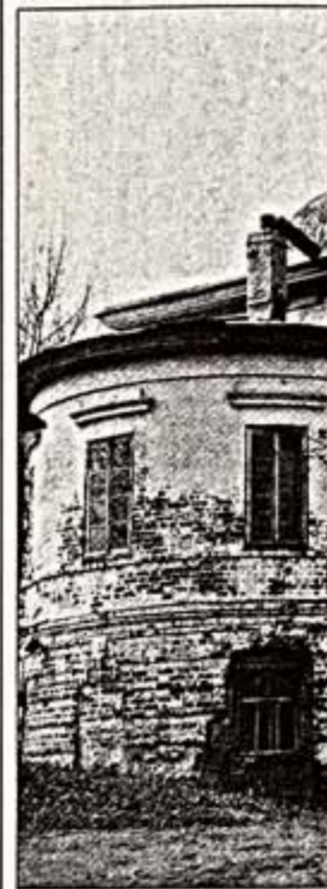
Николаевская церковь в Успенском Александрово-Кустовском монастыре

Чем дальше вглубь истории уходят от нас события, происходящие в России в начале XIX века, тем более (что вполне естественно) у нас возникает желание анализировать происходящее, отыскивая в нем все новые и новые аспекты и грани.