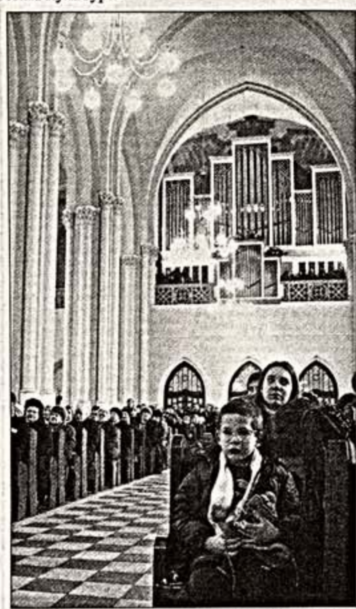
В кафедральном соборе Непорочного Зачатия Девы Марии в Москве