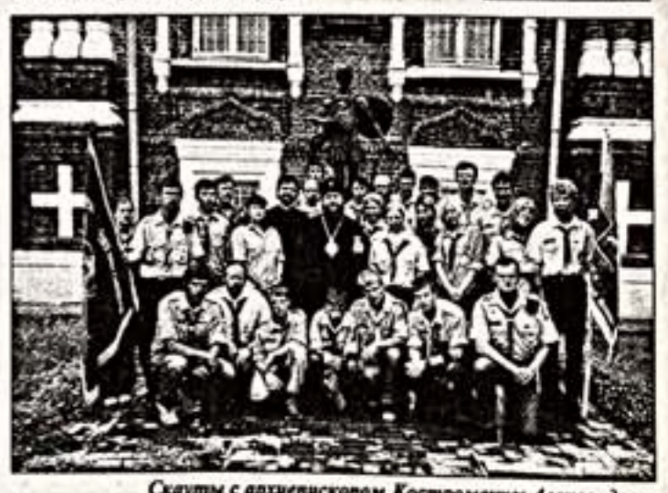
Скауты с архиепископом Костромским Александром