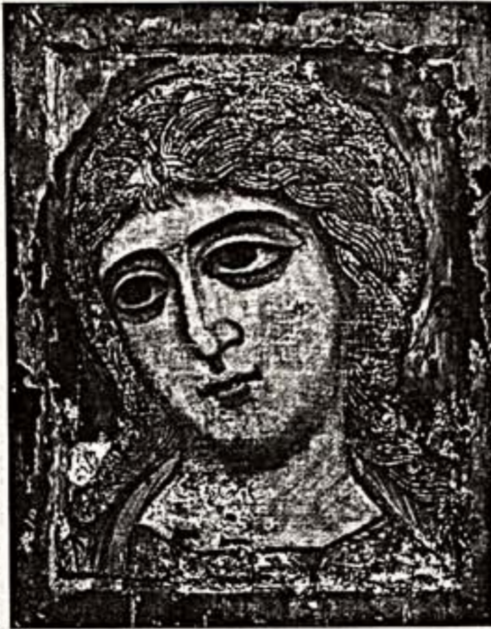
"Ангел Златые Власы". Около 1200 г. Баттиста Тинто, Франческо Гварди...