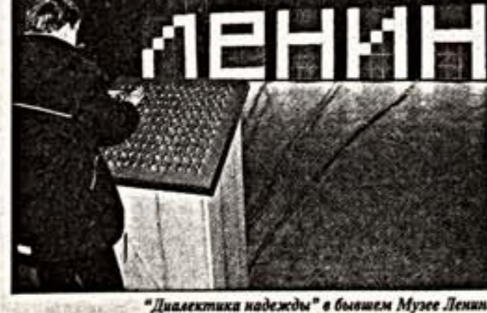
"Диалектика надежды" в бывшем Музее Ленина