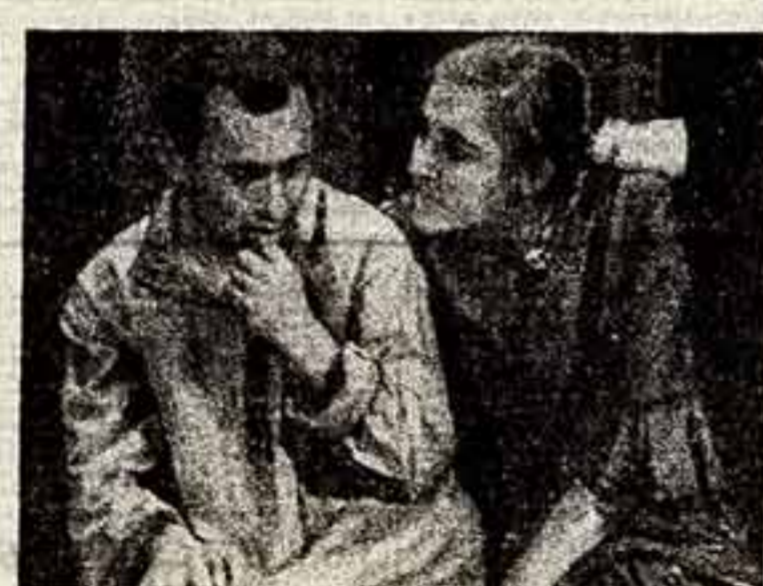
Сцена из спектакля «На было ни греша, да восту летима»...

№ 4050. 4 коп. — темная, красная и ультрафиолетовая.