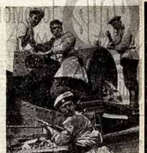
Кадр из телефильма.