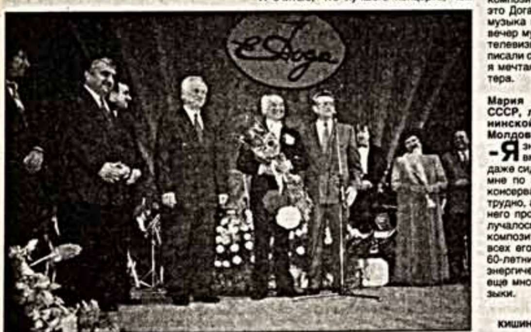
ПЕТР ЛУЧИНСКИЙ, президент Молдовы...