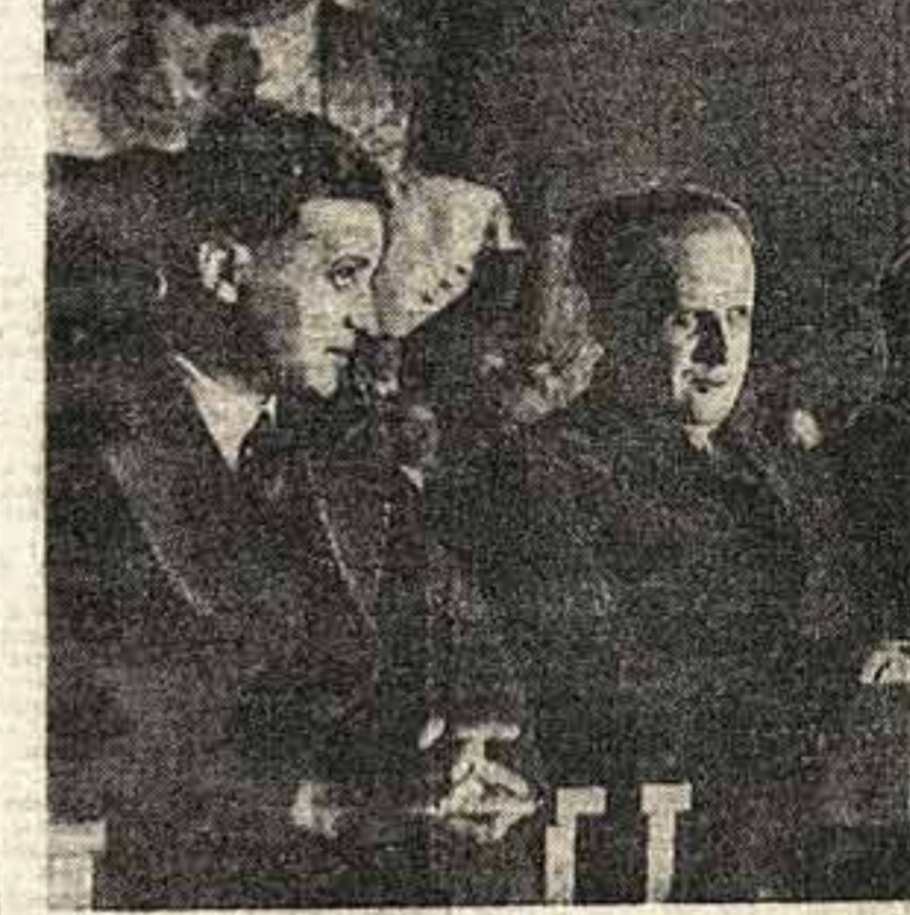
В пленуму торжественного заседания, посвященного 15-летию советского кинематографа...