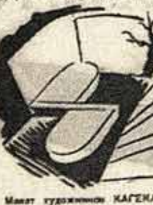
Минут художника КАГЕНА и «Антигона»

Минут художника КАГЕНА и «Антигона». Минут художника КАГЕНА и «Антигона».