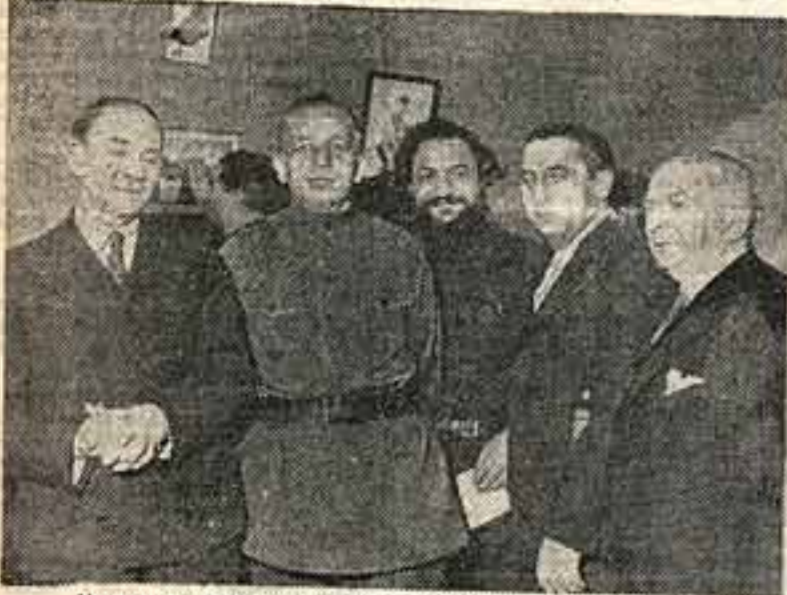
Нарком по просвещению А. С. Бубнов на открытии выставки

В связи с исполнившимся 25-летием творческой деятельности Е. А. Кацмана «Союзхудожников» организовала большую персональную юбилейную выставку художника.