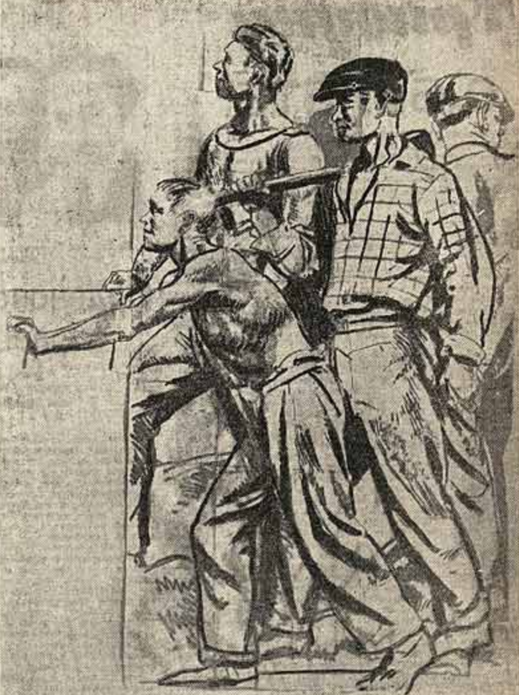
В настоящее время академик Е. Е. Лансеро заканчивает эскизы майолик, которые будут оформлять станции метро «Комсомольская площадь». На фото — эскиз майоликового панно «Комсомол на строительстве метро».