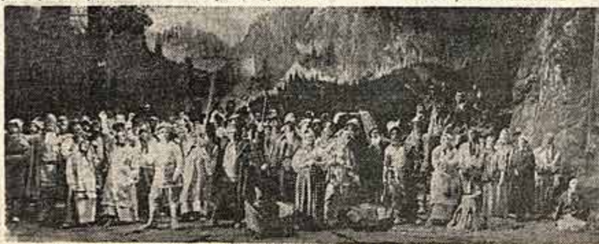
Опера «Орлеан» (финал первого акта) в Свердловском театре оперы и балета им. Луначарского