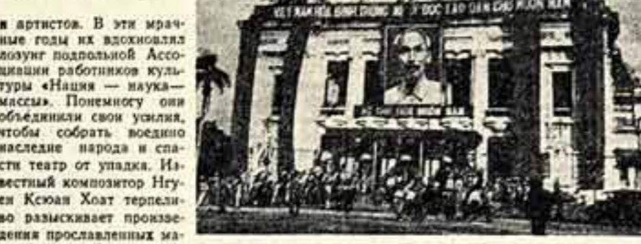
Здание Государственного народного театра в Ханое.

Плачевное состояние национального театрального искусства в годы колониальной зависимости Вьетнама вызвало протест со стороны прогрессивных драматургов и артистов. В эти мрачные годы их вдохновлял лозунг подпольной Ассоциации работников культуры «Нация — наука — массы». Понемногу они объединили свои усилия, чтобы собрать воедино наследие народа и спасти театр от упадка. Известный композитор Нгуен Кюан Хоат терпеливо разыскивает произведения прославленных мастеров прошлого, собирает тексты и музыку классических народных опер. С большим трудом ему удалось напеть ноты некоторых из этих пьес.