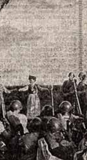
Из фотолегисии Огненных лет