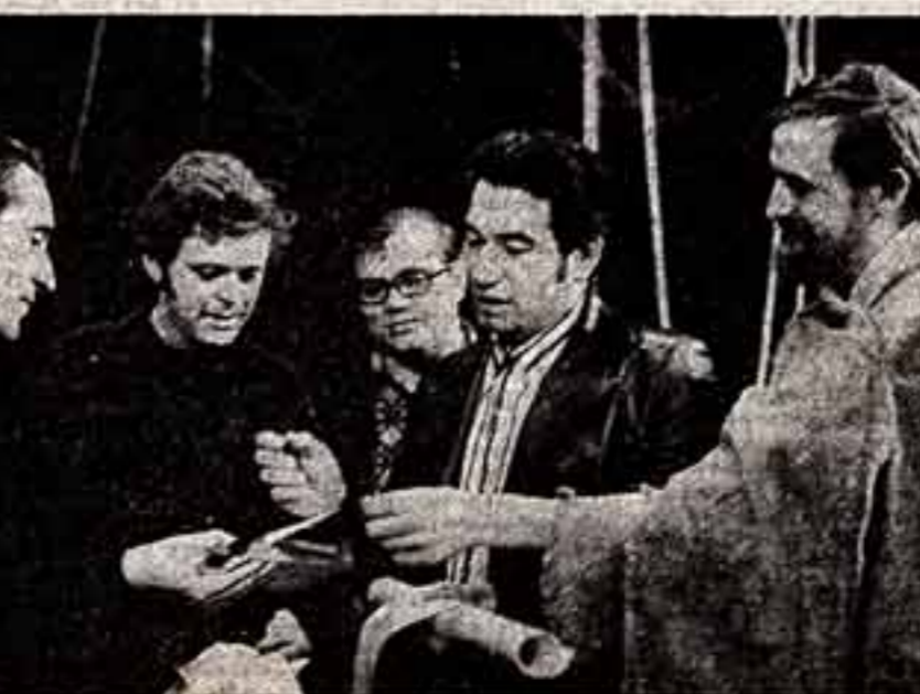
В Москве, на сценических площадках ВТО, ЦДР, Дома ученых, дворцов культуры состоялся показ спектаклей самодельных театров страны в рамках творческого семинара «Проблемы развития молодежных и студенческих театров». Свою новую работу, спектакль «После сказки...» по повести Чингиза Айтматова «Белый пароход», представил студентский театр Челябинского политехнического института имени Ленинского комсомола. В зале — видные деятели советского искусства. Сцена из спектакля «После сказки...». Н. Айтматов среди участников спектакля.