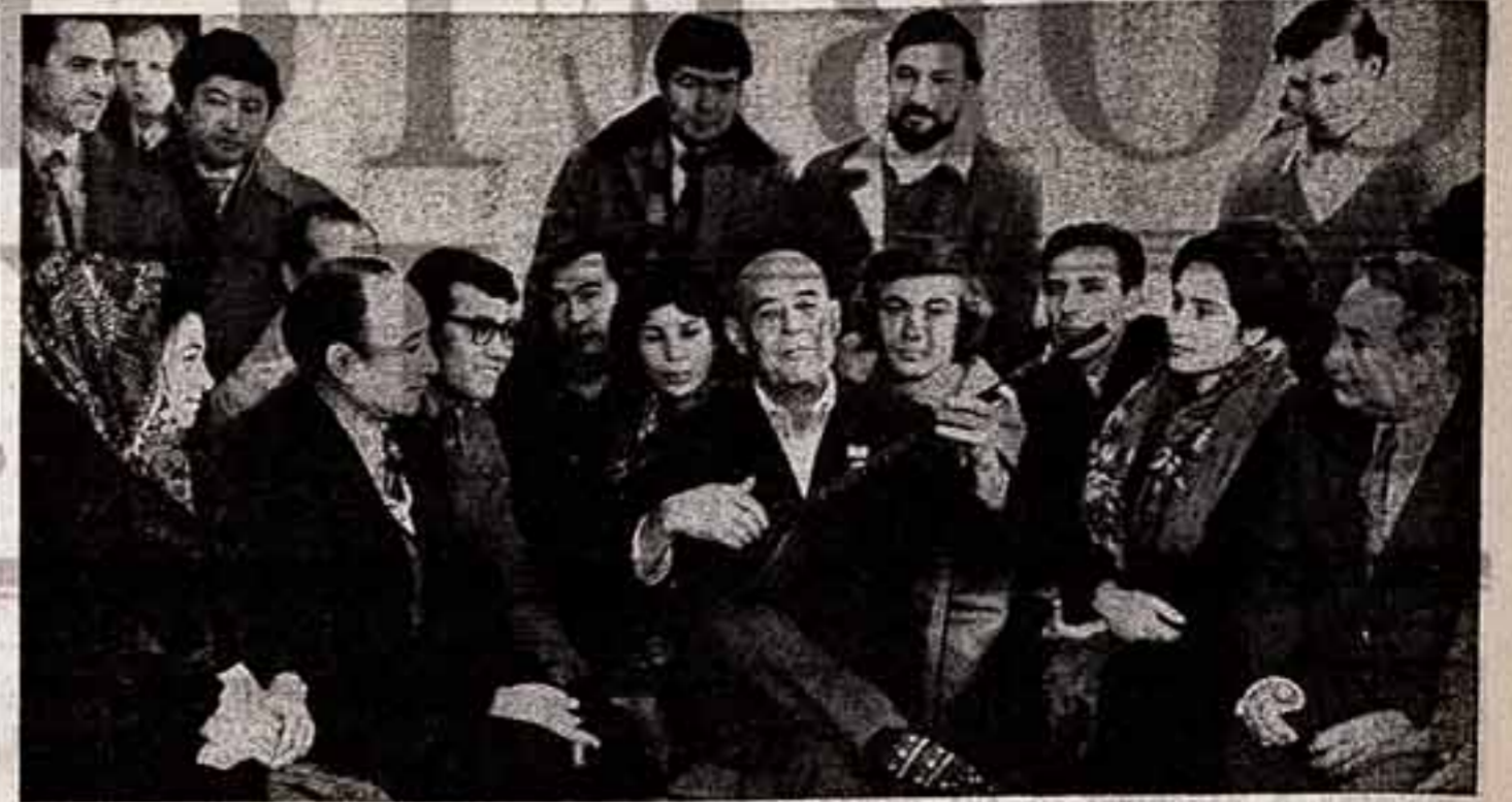
Это стало традицией: в воскресенье бы деятели искусства и литераторы Ашхабада собираются в Доме художника, чтобы поговорить о путях туркменского искусства...

Еще больший размах, новую силу набрало ныне всенародное социалистическое соревнование. Социалистические обязательства, которые вали на себя трудовые коллективы, являются выражением глубокого понимания партийными организациями и всеми трудящимися вывода декабрьского (1974 года)