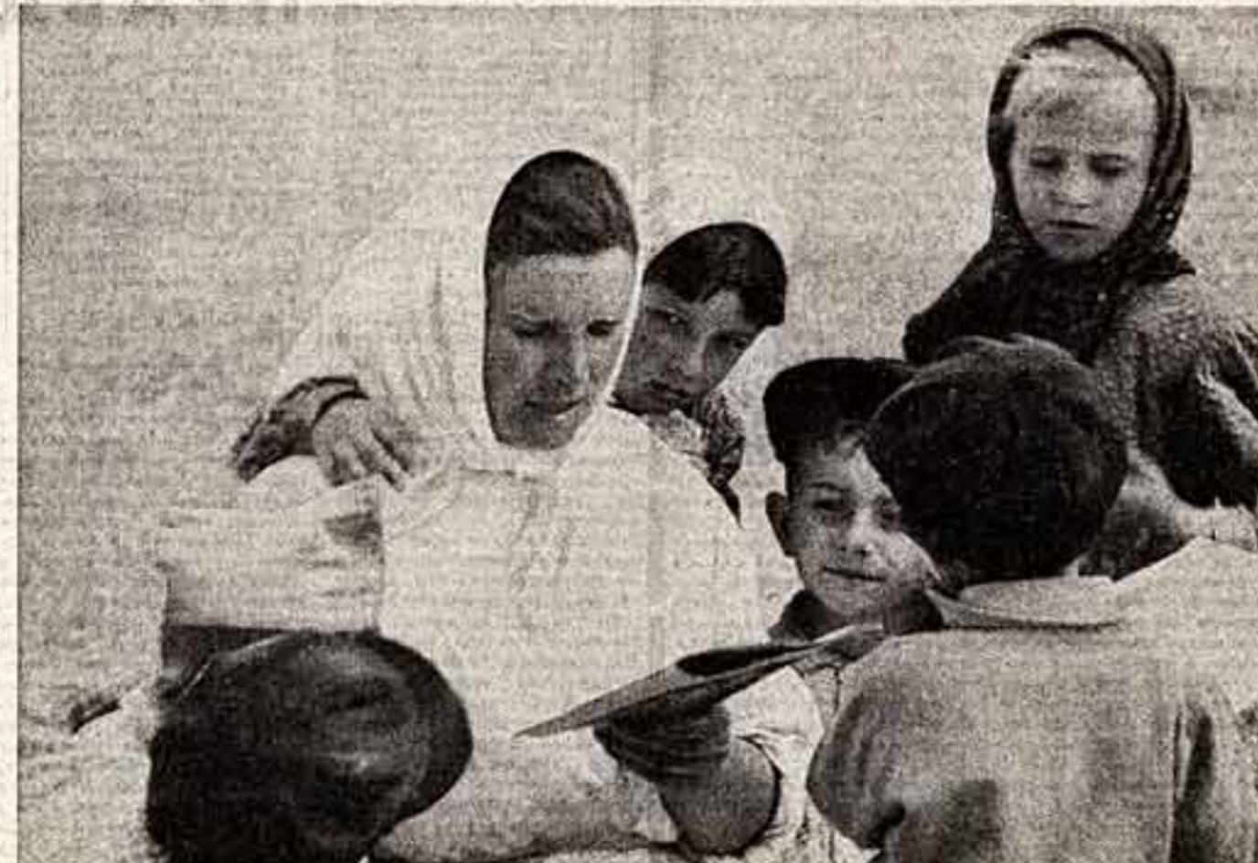
В. АНТИН. «О чем расскажет эта книга?..»

«Скажу про себя — скажу прямо — жизнь и многие жизненные передряги, которые пришлось пережить, мне доказали, что я сильная, и доказали это много раз, и я это знаю. Но знаешь, что мне часто говорили, да и до сих пор еще говорят. «Когда мы с вами познакомились, мы вам назвали такой молодой, хрупкой и слабой, а вы, оказывается, железная». Да, совершенно внешне и по внешним впечатлениям посторонние не имеют никакой цены, и неужели на самом деле каждый сильный человек должен быть непременно жалким, личным великой личности и женственности — по-моему, это «инюкда» не вытекает — выражение одного моего хорошего знакомого. Наоборот, в женственности и личности есть обаяние, которое тоже сила...»