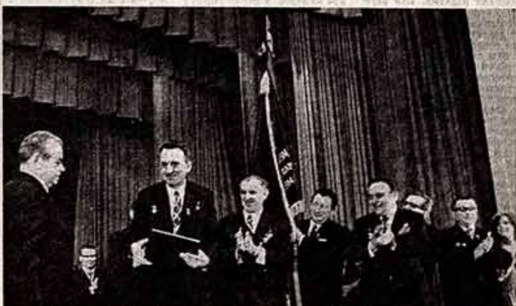
В президиуме торжественного заседания.

Товарищи! Юбилей советского энциклопедического дела совпадает с важнейшим событием общесоветского