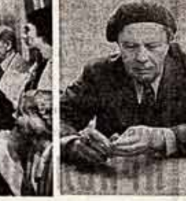
Из фотолегисии Огненных лет