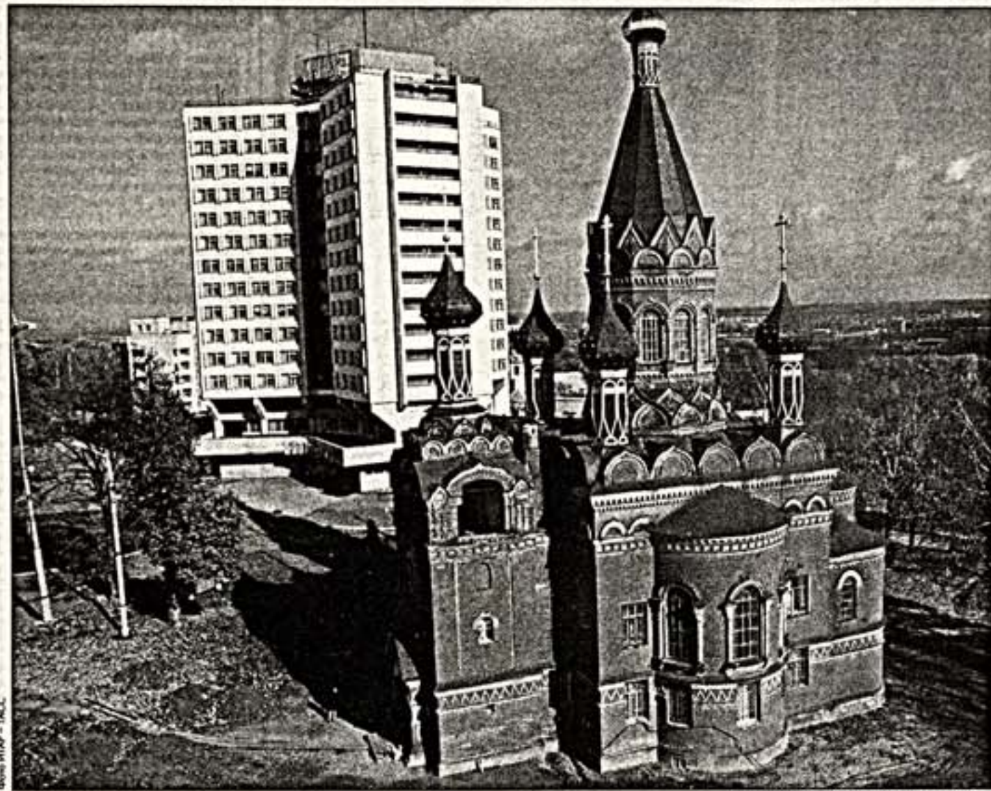
Спасопробовская церковь в Брянске

Самое удивительное в городе произошло и успешно трудится несколько мастеров. Они во многом делают погоду в музыкальной жизни города.