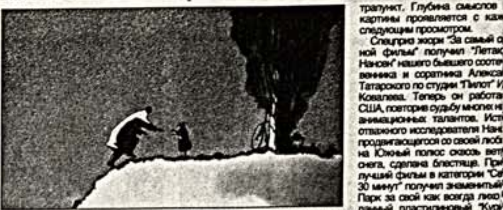
Кадр из фильма "Отцы и дочери"