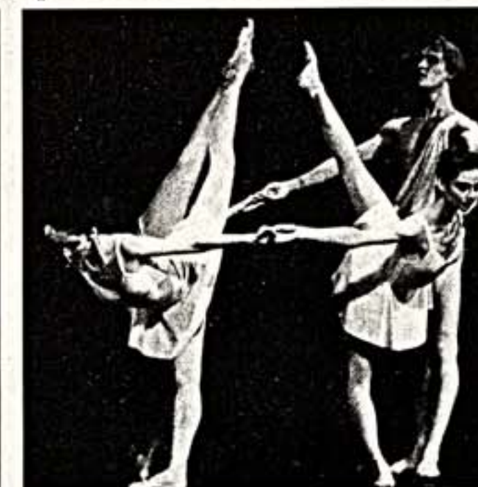
Сцена из спектакля "Аполлон Мусы", поставленного Дж.Баланчиным в 1928 г. и возобновленного в Мариинском театре в 1992 г.

ли ужасно в Москве. Петипа поставил "Лебединое озеро" в Петербурге, все сделал по-своему, и публика приняла.