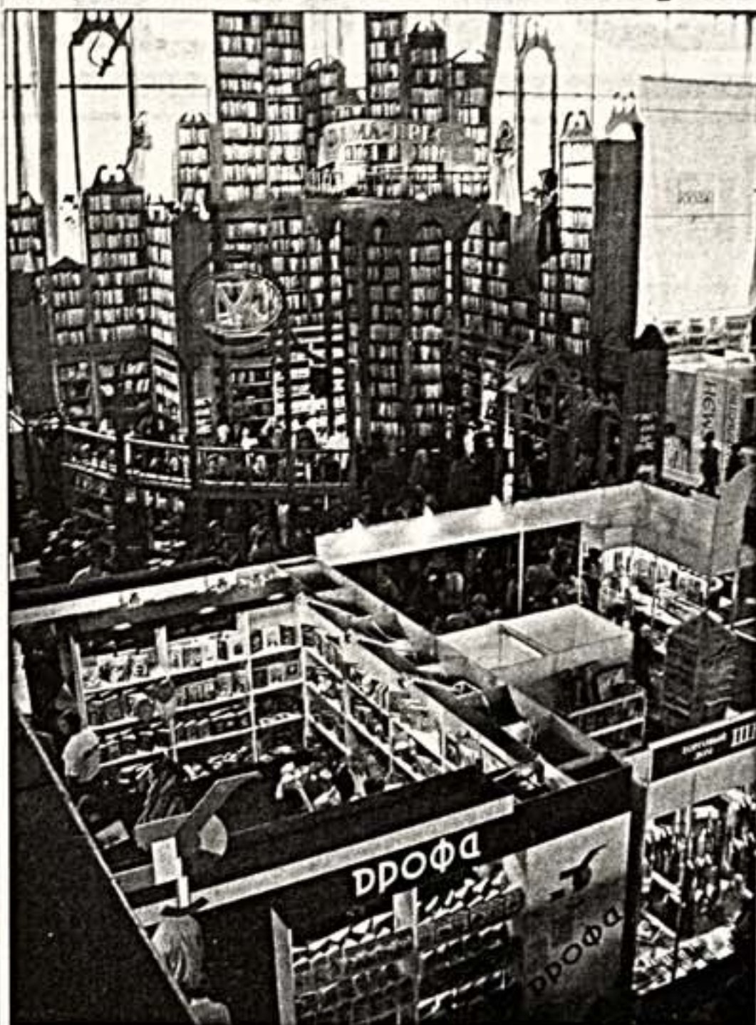
В Москве завершилась 14-я Московская международная книжная выставка-ярмарка (ММКВЯ). 2 тысячи представителей книжного бизнеса из 79 стран мира на 700 экспозициях и стендах представили около 100 тысяч наименований книг.