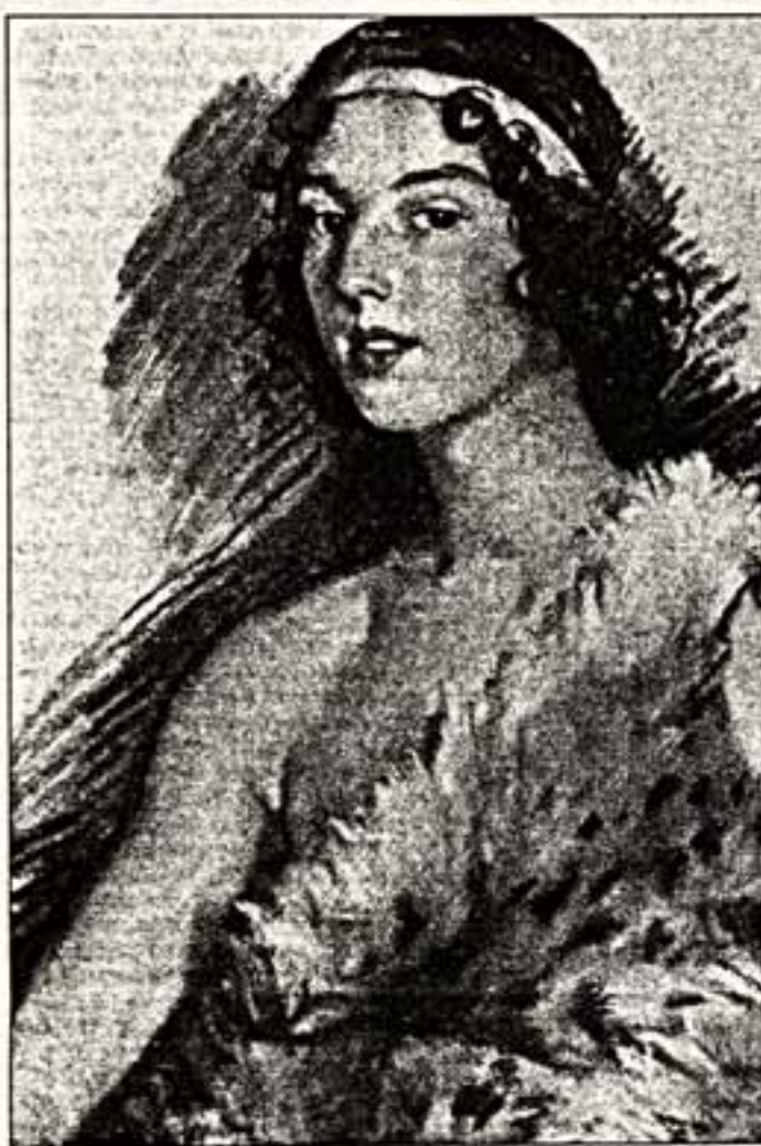
З.Сербракова. "Портрет Г.Баланчина" 1928 г.

Баланченя. Не все знают, что Игорь Федорович Стравинский любил музыку Чайковского.