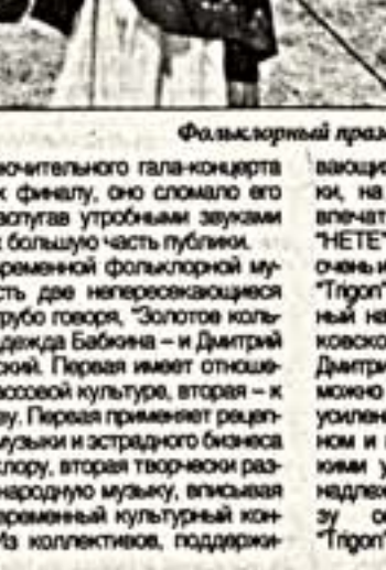
Фольклорный праздник "Эл Ойон" на Алтае

В современном фольклорной музыке есть две перекрывающиеся линии: грубо говоря, "Золотое кольцо" и "Нидежда Байбана".