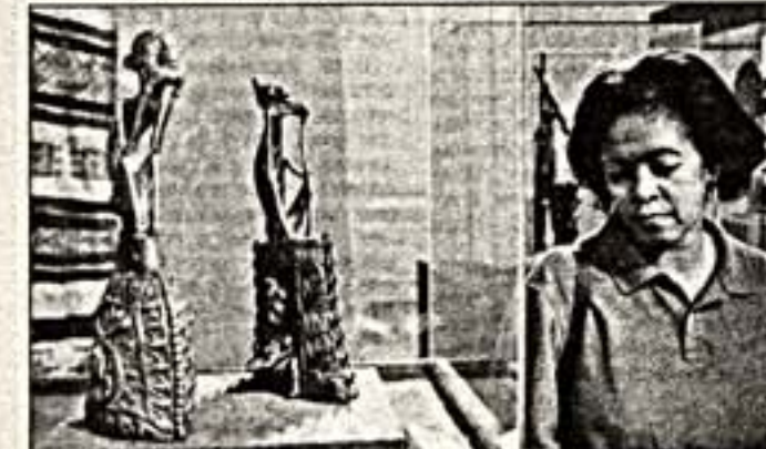
"Образы Тропической Африки" в Музее Востока