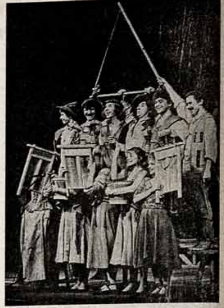
Сцена из спектакля «О бедном гусаре...»