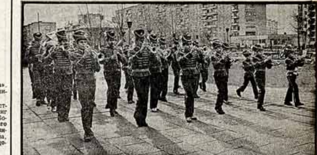
В подмосковном городе Реутове прошёл заключительный смотр-конкурс духовых оркестров культурно-просветительского Московского округа. В смотре участвовало свыше двадцати коллективов. Дипломами первой степени награждены духовые оркестры Дома пионеров города Железнодорожного (руководитель В. Васильев), Горки культуры завода «Ириксин» поселка Кулавы (руководитель Н. Куликин) и дворца культуры «Юность города Павлово-Посада (руководитель А. Гусель). В Малом оле прозвучат торжественным маршем по Красной площади.

31. Фрейх С. И. — автор сценария, Динеман А. Л. — режиссер, Зурин О. А. — оператор. Научно-популярный фильм «Ю. В. Андронов, Страницы жизни» производства Центральной студии документальных фильмов.