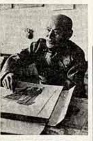
Отправилась и доктору Арманду Хаммеру...