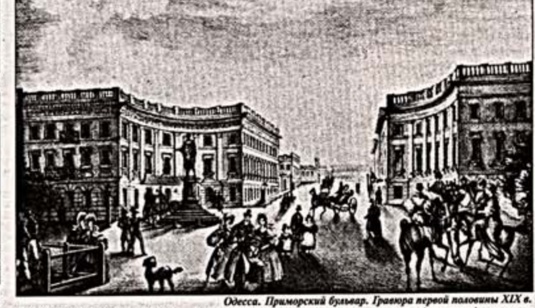
Одесса. Приморский бульвар. Гравюра первой половины XIX в.