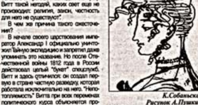
К. Собольская. Рисунок А. Пущина...