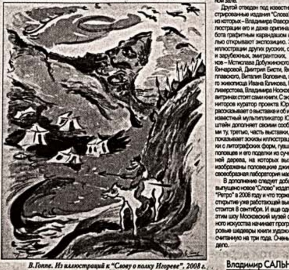
В.Голле. Из иллюстраций к "Слову о полку Игореве", 2008 г.