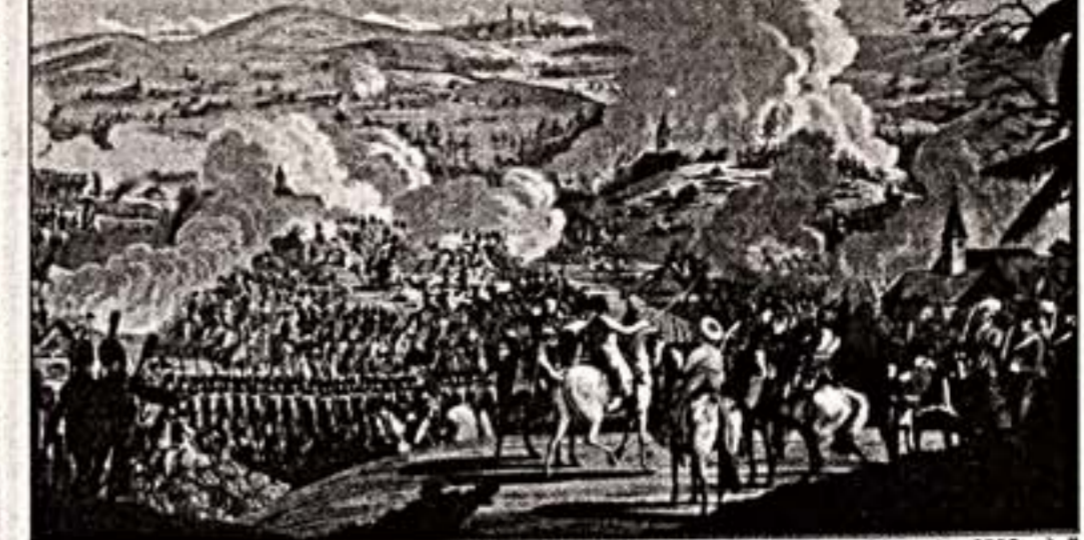
И. Русенко. "Сражение при Аустерлице 20 ноября 1805 года"