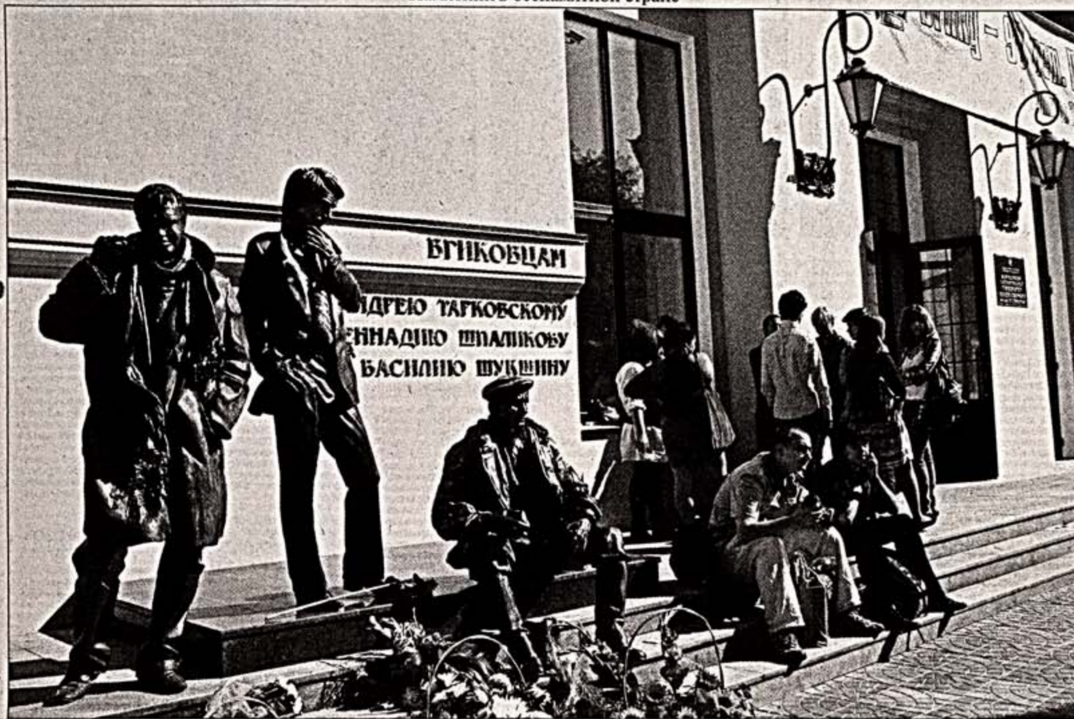
Нынешнее поколение студентов ВГИКа уже не знает ничего про Шабалина. Следующие забудут Шабалина и Тарковского?