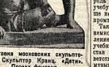
Выставка московских скульпторов. Скульптор Иран. «Дети». Проект фонтана.