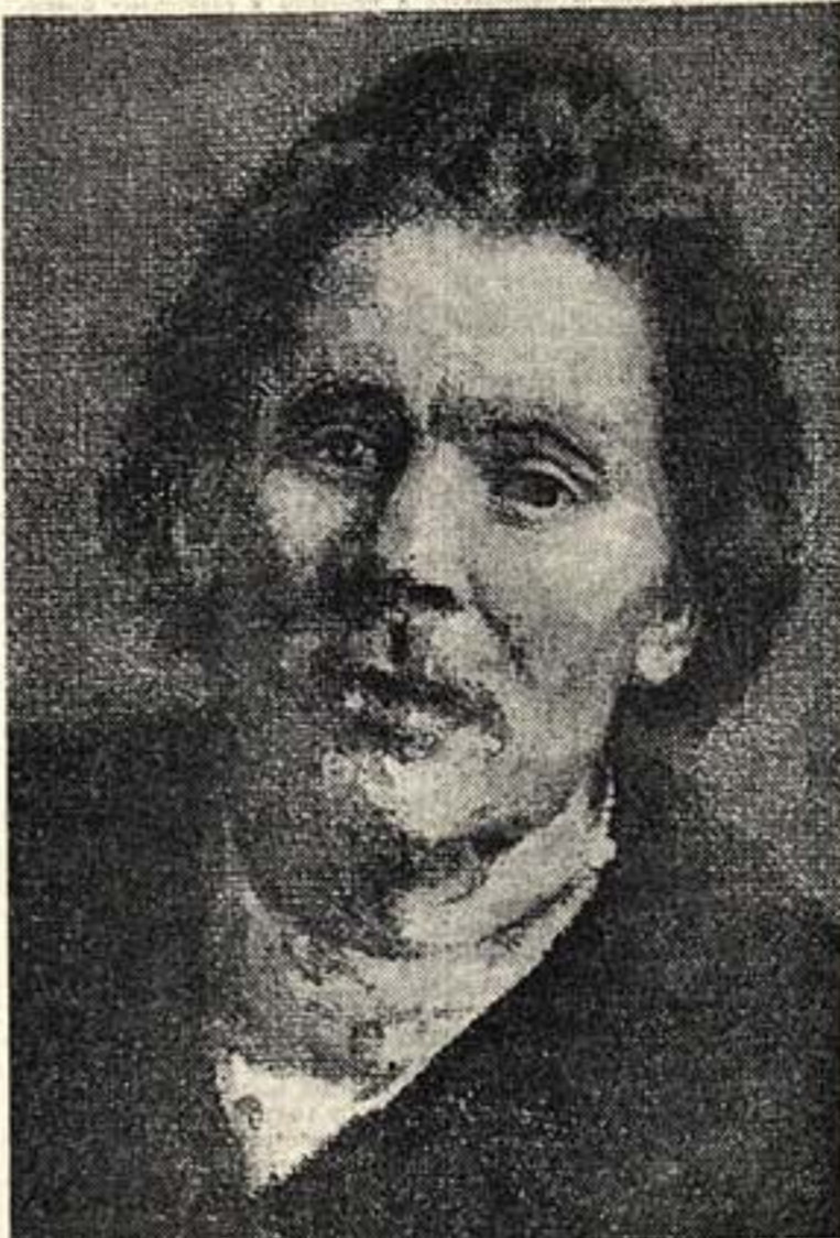
А. М. Горький. С картинами И. Е. Репина.