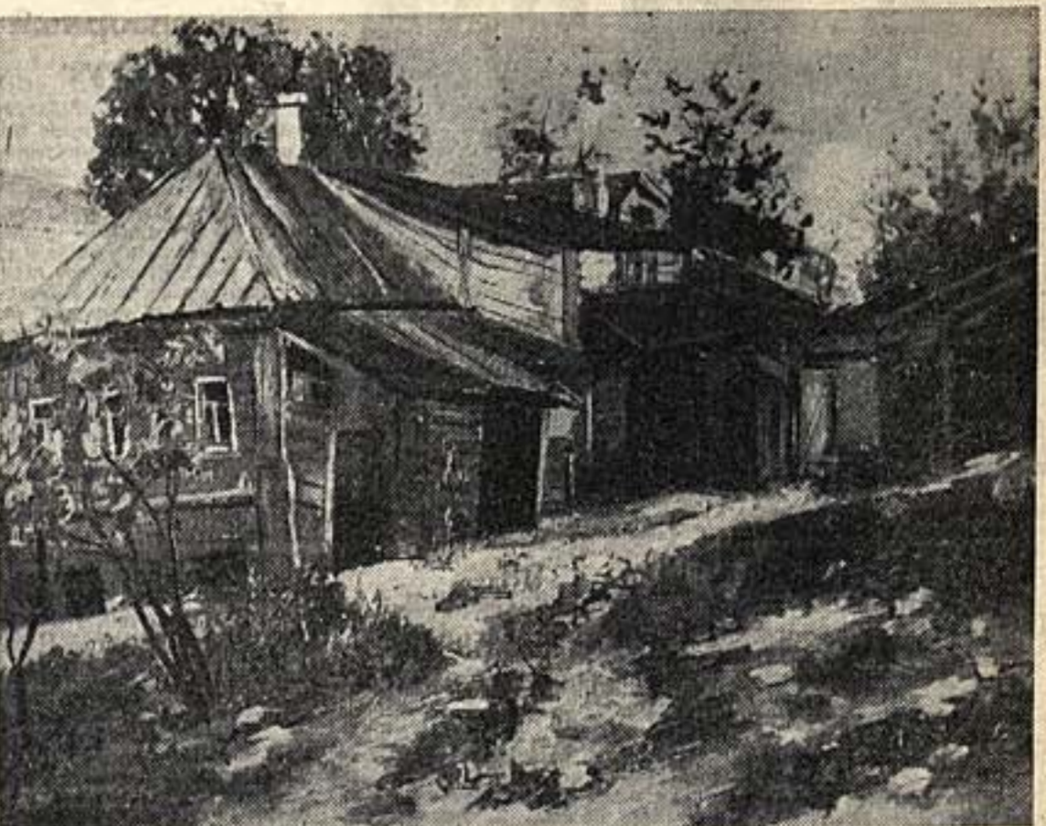
Худ. Богородский «Домик Горького» (г. Горький).