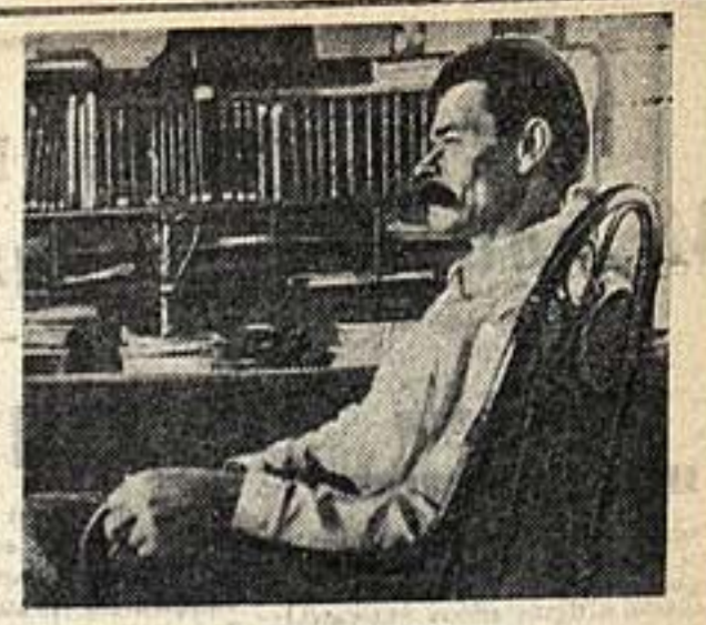
А. М. Горький в 1910 году.