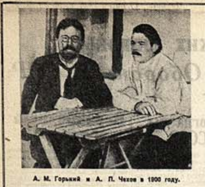
А. М. Горький и А. П. Чехов в 1900 году.