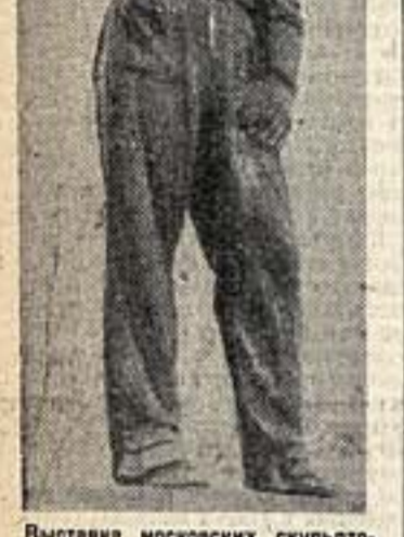
Выставка московских скульпторов. «Летчик», работа скульптора Шварца.

На советской сцене исполняют и многие беллетристические произведения А. М. Горького: «26 и одна», «Мальва», «Челкан», «Мать», «Вурьянские», «Песни о соловьях», «Система», «Макар Чудра», «Алешка Гармакши», «О лямуре», «Стратегия моркости», «Ома Гордеев», «Рождение человека», «На плотях» и др.