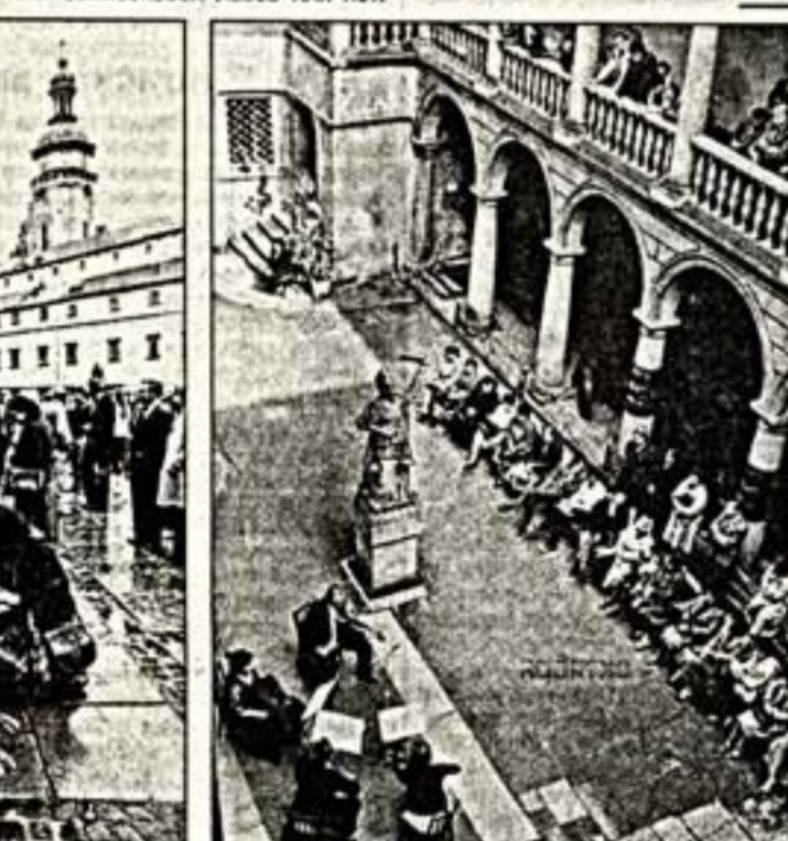
Слева: стали традиционными выставки-продажи изделий львовских мастеров. Справа: звучит старинная музыка (играет Львовский струнный квартет в итальянском дворике Львовского исторического музея)