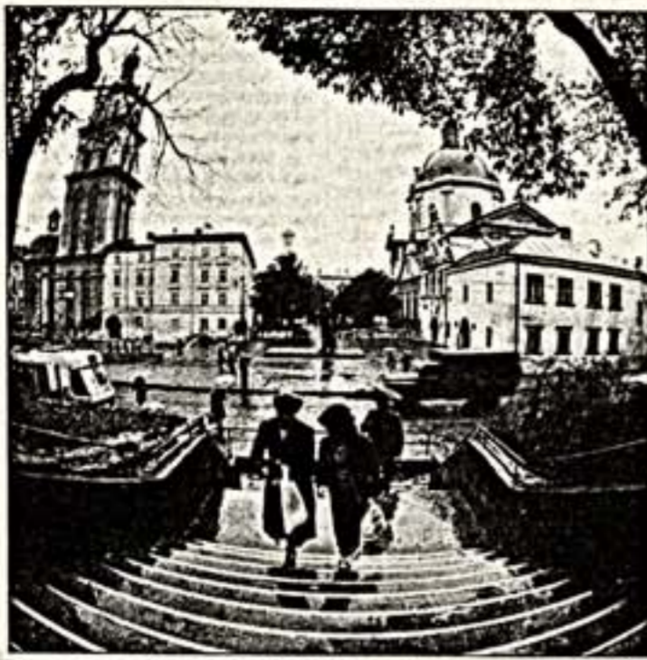
Слева сверху: по Львову на отреставрированном трамвае 1903 г. выгулка. Справа сверху: памятник Ивану Федорову. В 1574 г. он выпустил здесь первую на Украине книгу "Апостол". Снизу: во Львове великий просветитель и похоронен. Снизу: в старом Львове