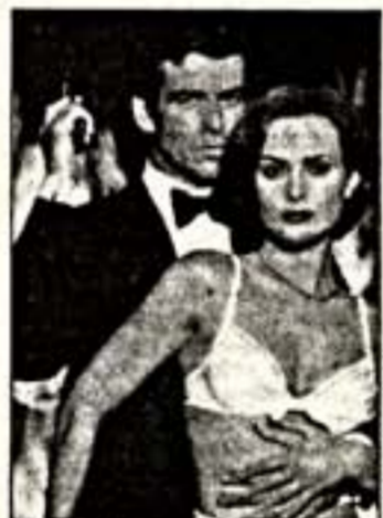
П.Броснан в Н.Скорупко в фильме "Золотой глаз"