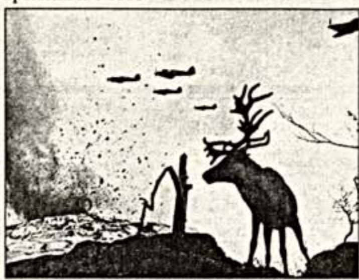
Слева: Е.Халдей. 1937 г. Справа: война на Севере. 1941 г.