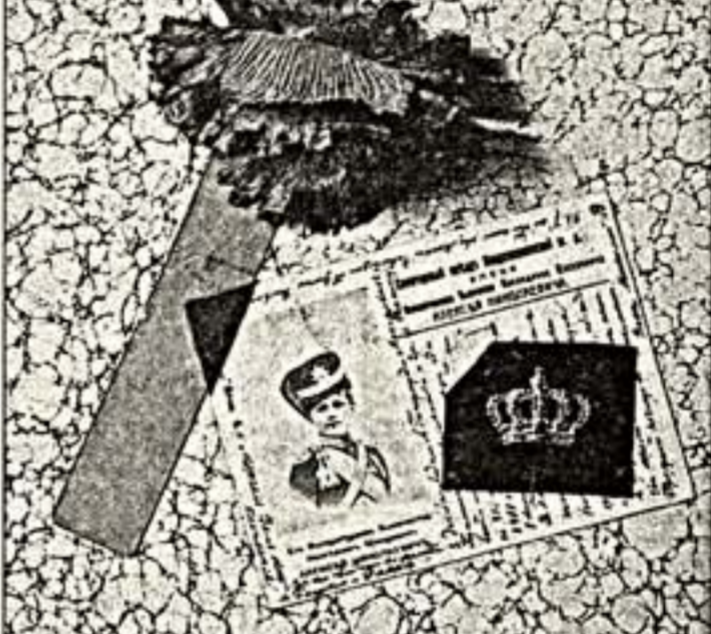
В.Виноградов. "Царевич". 1988 г.