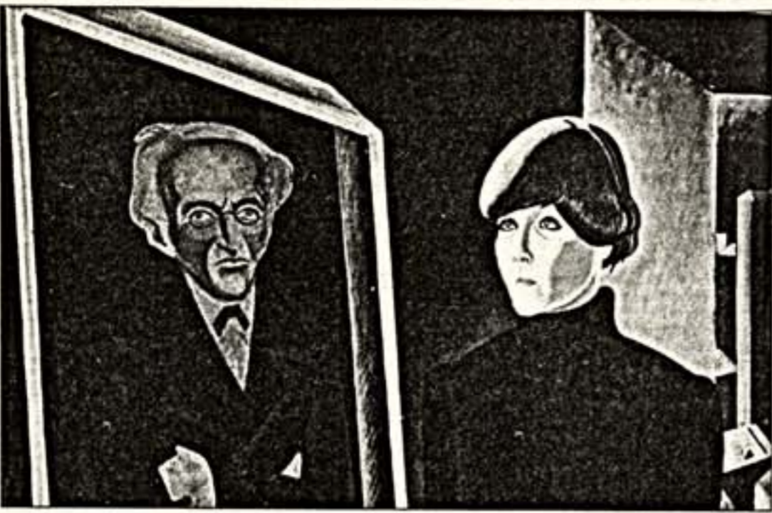
"Есть целый мир в душе твоей...", 1978 г.

И эта трагичная сопереживаемость миру художника, миру человека, мир изобретенного, возникает под ле каждого портрета, ныне представленного на персональной ретроспективной выставке провинциального народного художника России, действительного члена Российской академии художеств, лауреата Государственной премии СССР Игоря Обросова, открывшейся в залах Академии художеств, в споре и соперничестве с другими мастерами, Александром Солженицыным, Василием Шукшиным, Виктором Попковым, Павлом Никоновым, нам знакомых