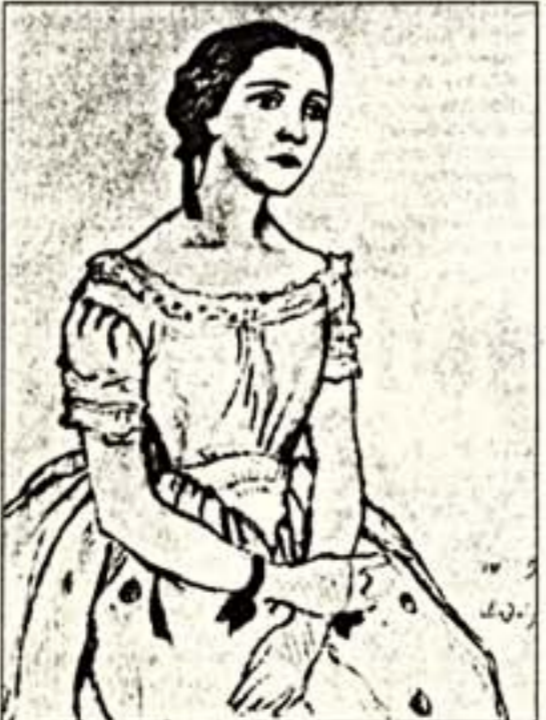
Слева: Л.Коренева — Верочка в спектакле «Месяц в деревне». Рисунки М.Добужинского.