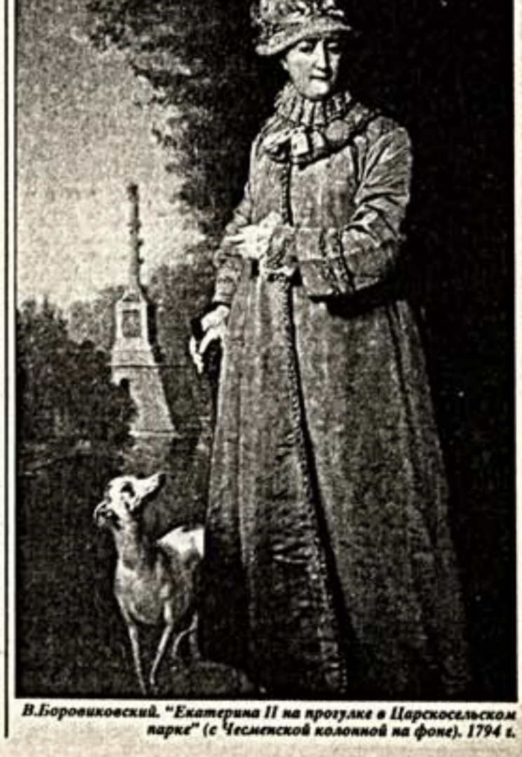
В.Боровиковский. "Екатерина II на прогулке в Царскомском парке" (с Чесменской колонной на фоне). 1794 г.