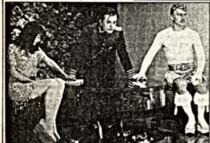
А.Заворотнюк, С.Безруков и Д.Бродский в сцене из спектакля