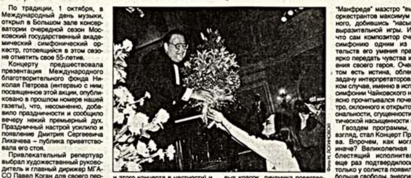
и этого концерта в частности) и, наконец, "Манфред" Чайковского - одно из тех сочинений композитора, которые не заиграют "до дыр".