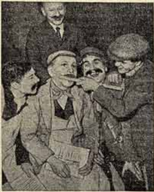
На сцене: сцена из спектакля «Филантроп в рваных брюках» в театре «Юинг».

После войны приобрели большую популярность балет и опера. Впервые после Второй мировой войны в Англии была поставлена опера «Дидона и Эней» (прим. ред.).