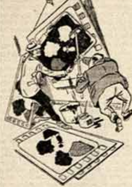
Шурш, ладн. Рис. С. АНДРЕЕВА.