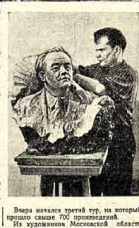
Вчера начался третий тур, на который прошло свыше 700 произведений. Из художников Московской области

В Москву со всех концов Российской Федерации съехалось много художников. Часть из них расположилась на творческих базах как в самом городе, так и в Подмосковье, часть — в здании Оргкомитета Союза советских художников, напоминающем сейчас собой скорее мастерскую. Художники приглашены для отбора их работ на республиканскую выставку, которая на днях откроется на Кузнецком мосту. Сотни живописцев, скульпторов, графиков, мастеров прикладного искусства прислали свои произведения. Выставочный комитет республиканской выставки, в который вошло более двадцати выдающихся художников, скульпторов и искусствоведов, уже провел первый тур. Просмотрено около 2.400 произведений. Наиболее богато, как и на предыдущих выставках, будет представлена живопись. Из работ, просмотренных на первом туре, живописных было 1.524, скульптурных 111, графических 748. 1 ноября началась вторая тур, на который было собрано 1.039 работ. Из просмотренных за это время произведений было 743 произведения живописи, 15 скульптур, 277 графических работ, 4 — резьба по дереву, 12 — лаки. Скульптура будет еще дополнительно просматриваться.