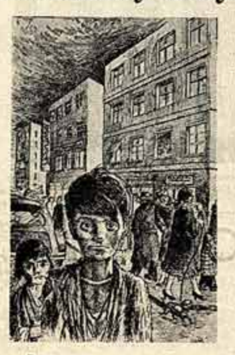
«В столице солнечных лучей». Рисунок Радаана Шагала.

Другой рисунок Р. Шагала — «В столице солнечных лучей» — изображает беспризорных детей в капиталистическом городе. Мы видим одну из улиц Бейрута. На переднем плане двое детей. Жалкие лохмотья едва прикрывают их худые, изможденные тела. Не по-детски печальные и усталые глаза, глубоко ввалившиеся щеки красноречивее слов говорят об их трагической судьбе. На втором плане — витрины магазинов, шикарные автомобили, богатая публика. Этот контраст неслучайно называется «В столице солнечных лучей». Картины на жизни рабочих, ремесленников, крестьян, городской и сельской бедноты показывают, что художником хорошо знакома жизнь этих людей. Это не случайные многие художники пришли в искусство из народа и сами испытали все тяготы и невзгоды своих героев. Значительная группа художников, чтобы прокормить себя и