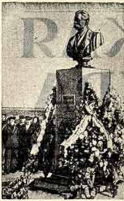
В 1891 году село Камыдино Новодедского района посещал А. М. Горький. Именно в этом селе установлен бюст великого писателя. На снимке: на открытии бюста А. М. Горького в селе Камыдино.