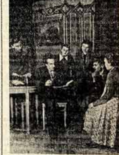
Ростовская область. Большой популярностью пользуется районный дом культуры в селе Александровке. Образцовому обслуживанию труженников сельского хозяйства способствует многоиспытанный актер рабочих, служащих и домохозяек, а также шеф-работники Ростовского театра музыкальной комедии, передающие свой опыт художественного мастерства членам театрального коллектива.

В совещании, начавшемся 12 ноября, участвуют представители восьми областей РСФСР — Московской, Рязанской, Тамбовской, Ивановской, Калужской, Ярославской, Орловской и Курской.