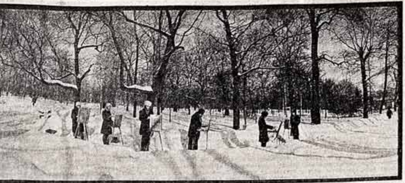
Старейшему художественному училищу Пензы, которое носит имя замечательного художника-передвижника К. Соколовского, не так давно исполнилось 80 лет. За свою восьмидесятилетнюю историю это учебное заведение выпустило более двух тысяч художников.